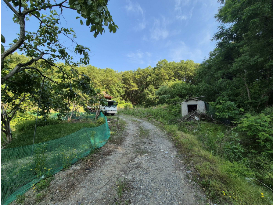
본건 및 부근 전경