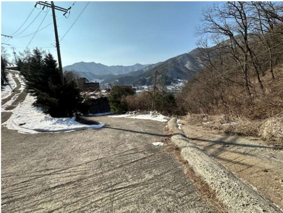
본건 및 인근전경