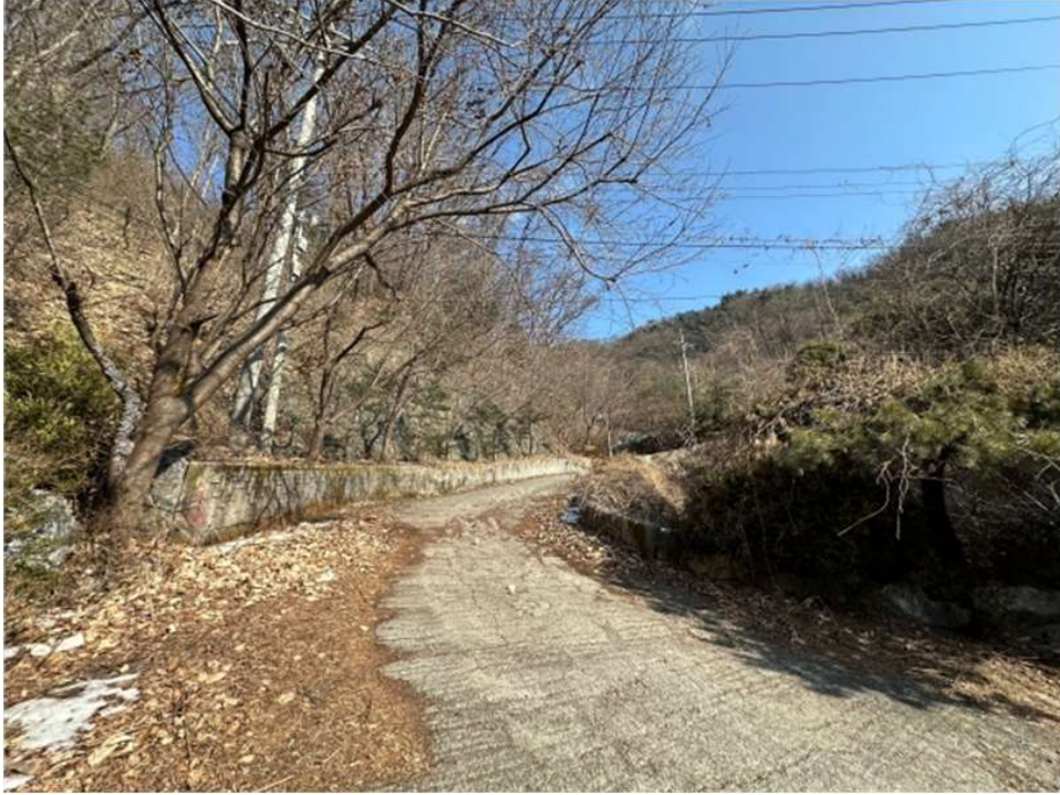
본건 및 인근전경