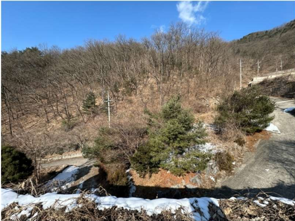
본건 및 인근전경