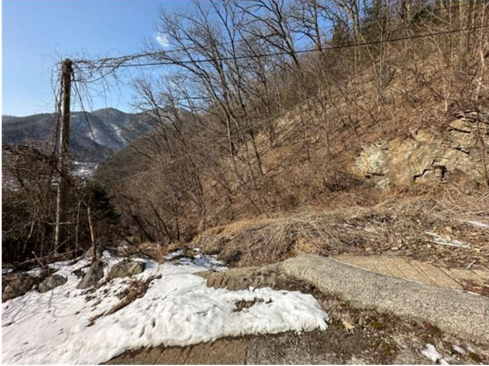
본건 및 인근전경