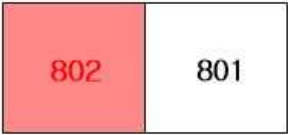
[본건 "다산 한신 더휴" 제701동 제8층 호별배치도]

소재지 경기도 남양주시 다산동 681 다산 한신 더휴 701동 8층 802호