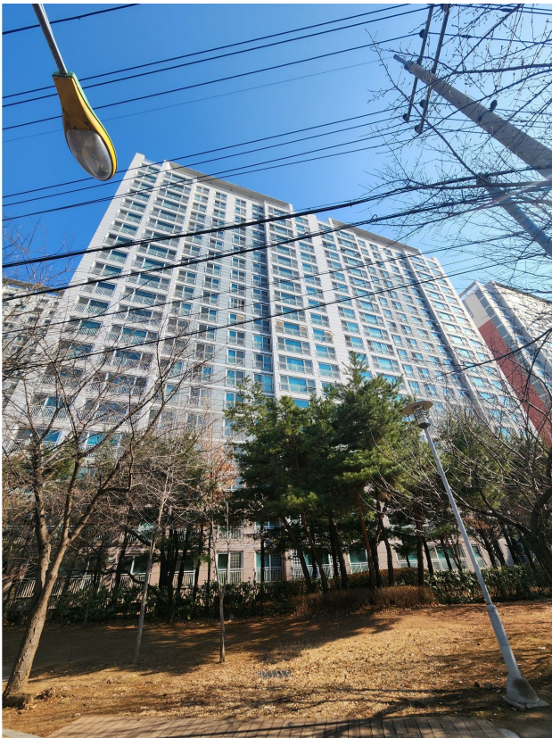
본건 동 전경