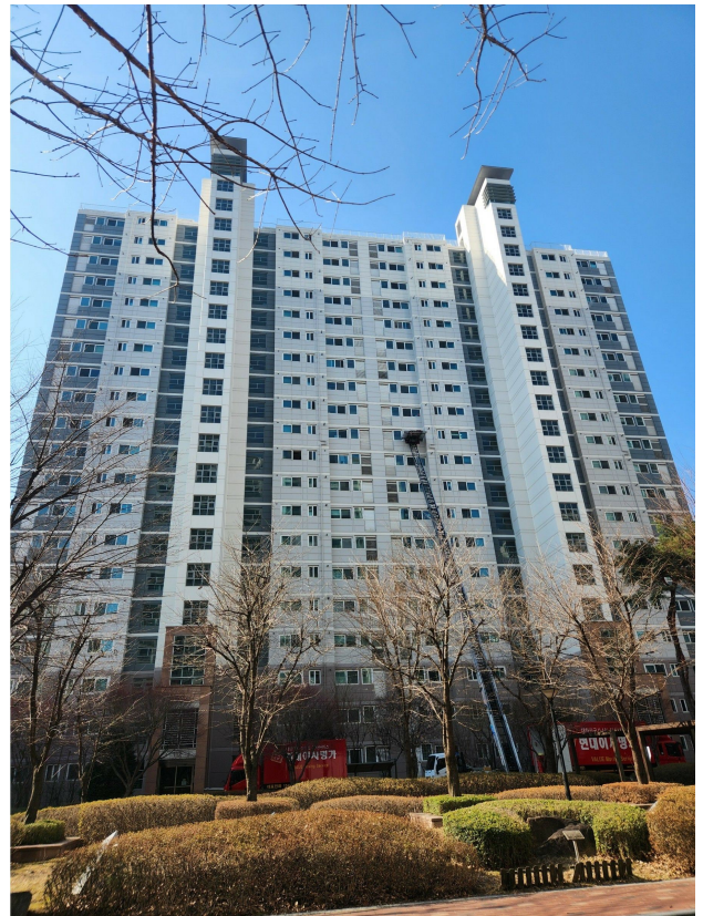
본건 동 전경