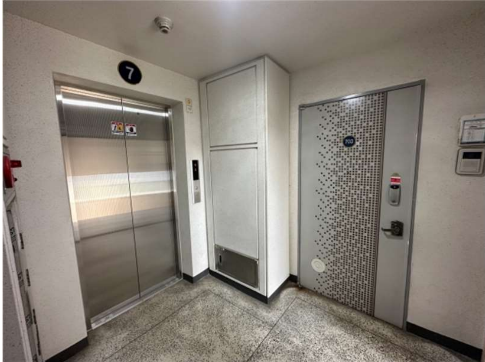
본건 건물(107동) 3,4호 라인 7층 복도 전경