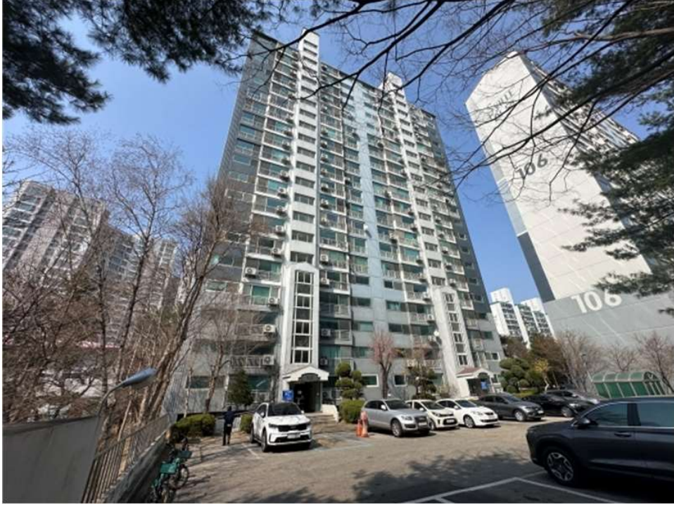
본건 건물(107동) 전경