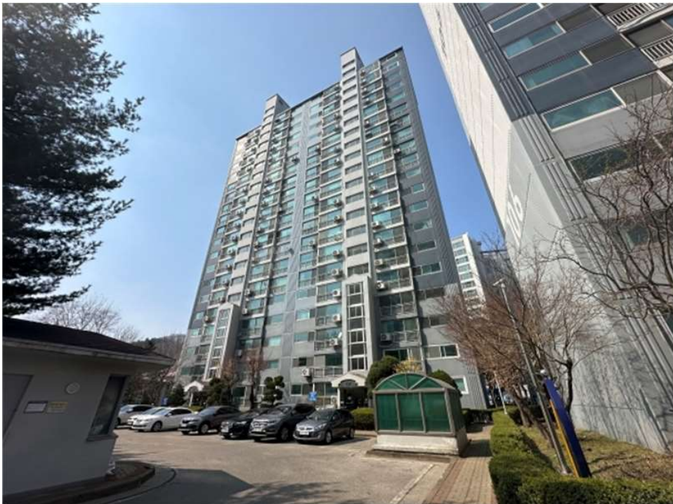
본건 건물(107동) 전경