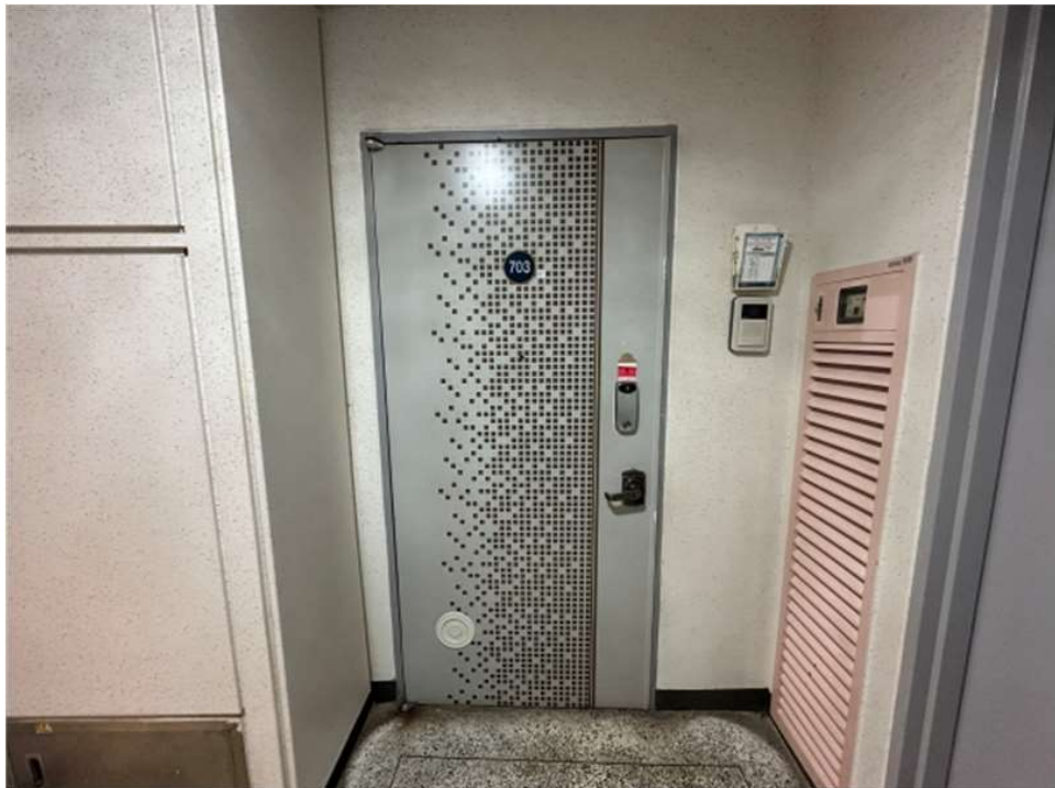
본건 출입문(703호) 전경