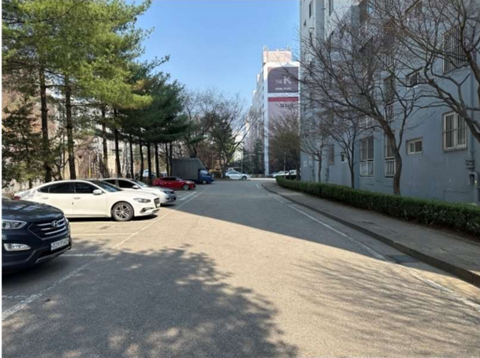
본건 단지내 지상주차장 전경