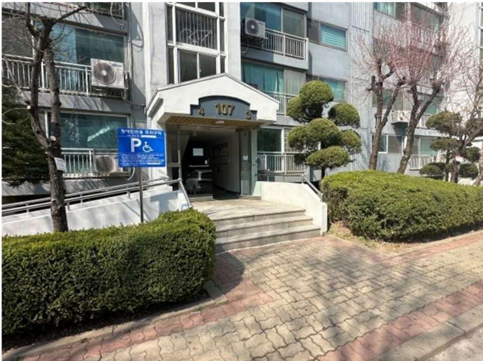
본건 건물(107동) 3,4호 라인 1층 출입구 전경