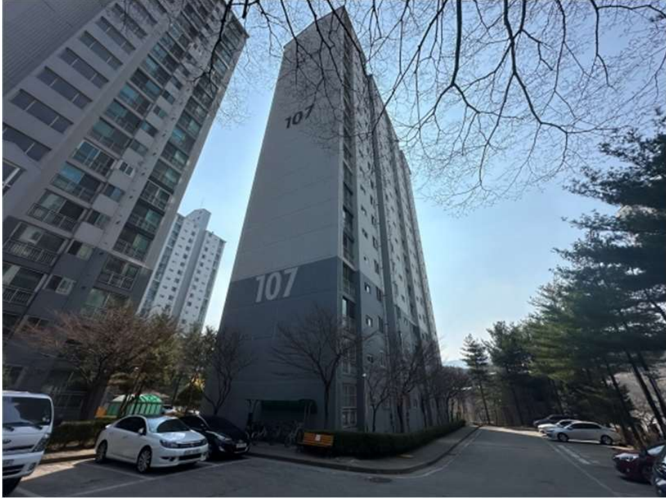
본건 건물(107동) 전경