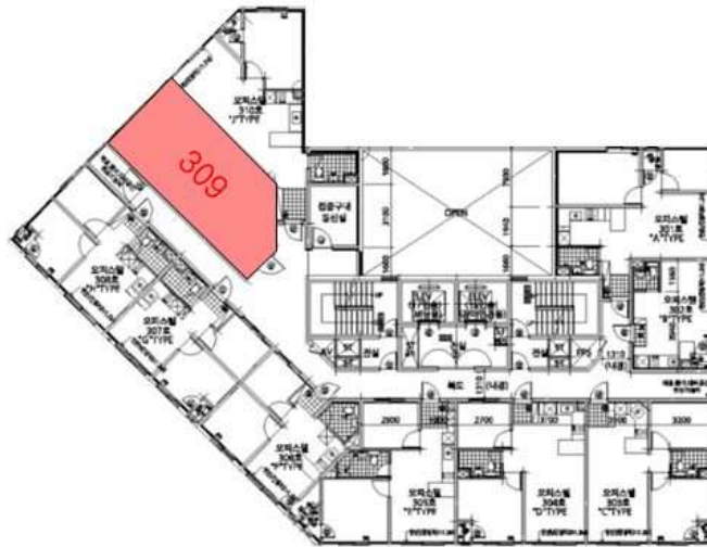
[본건 "구리아이폴리스" 제3층 호별배치도]