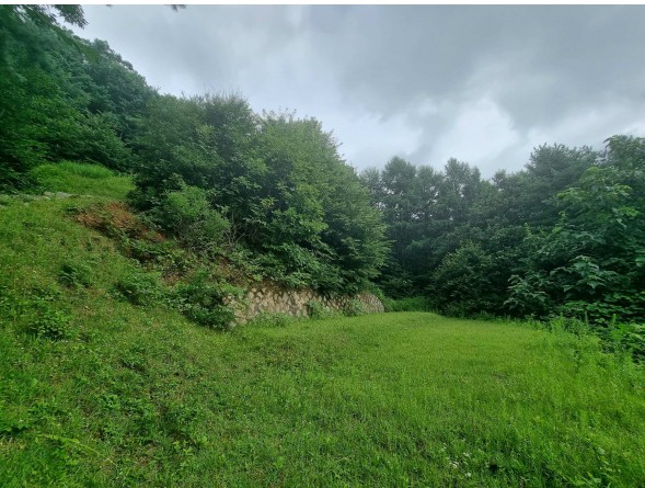
본건 전경 (묘지관련으로 추정되는 조성지)