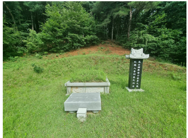
본건 토지상 분묘 소재부분