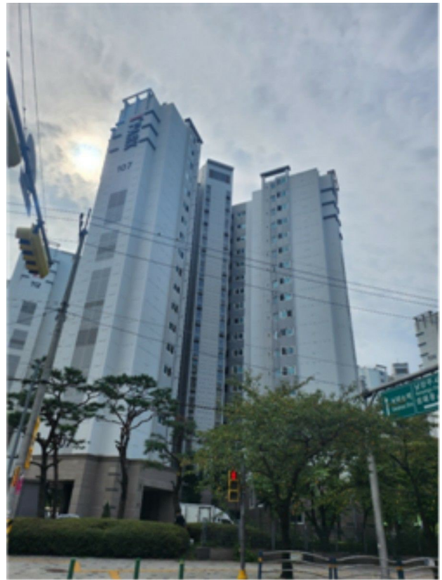
[ 본 건 전 경 ]