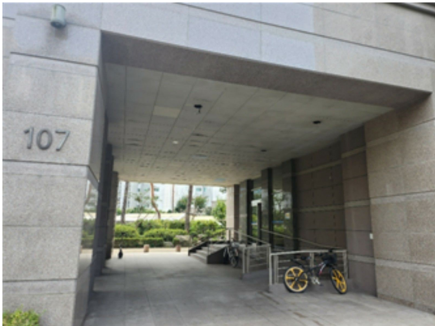
[ 출 입 구 전 경 ]