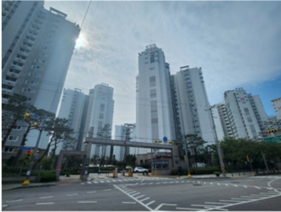
[ 단 지 전 경 ]