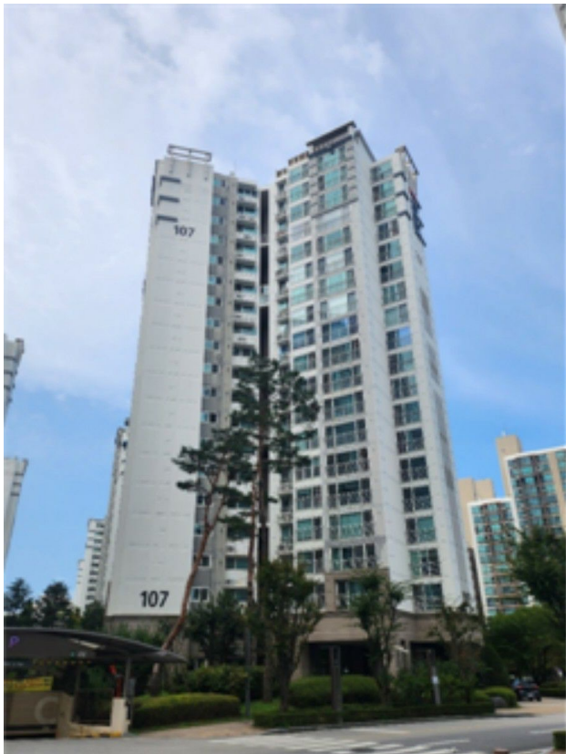
[ 본 건 전 경 ]