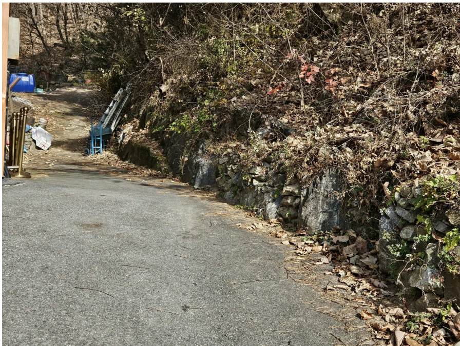
본건 남서측 인근 도로