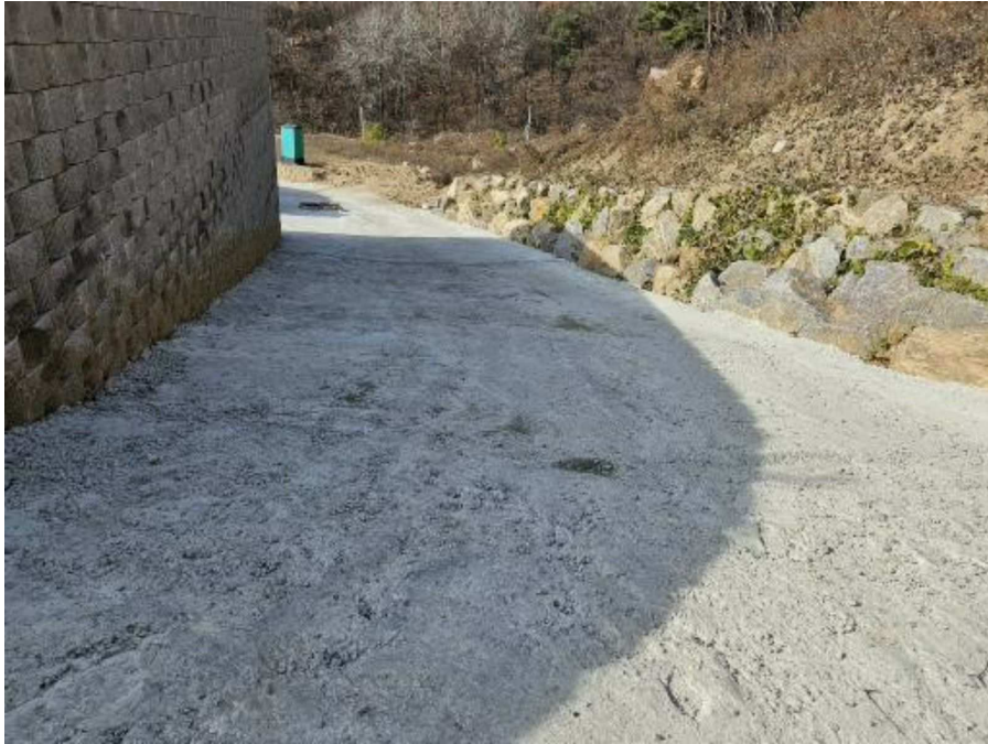
본건 남측 도로