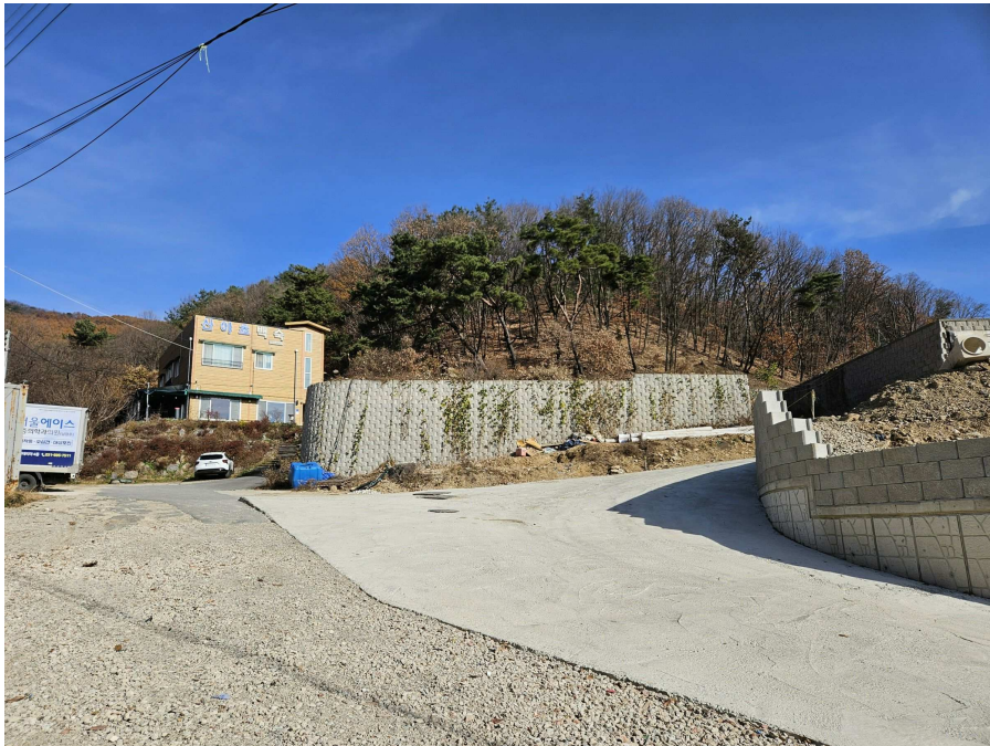
본건 및 주변