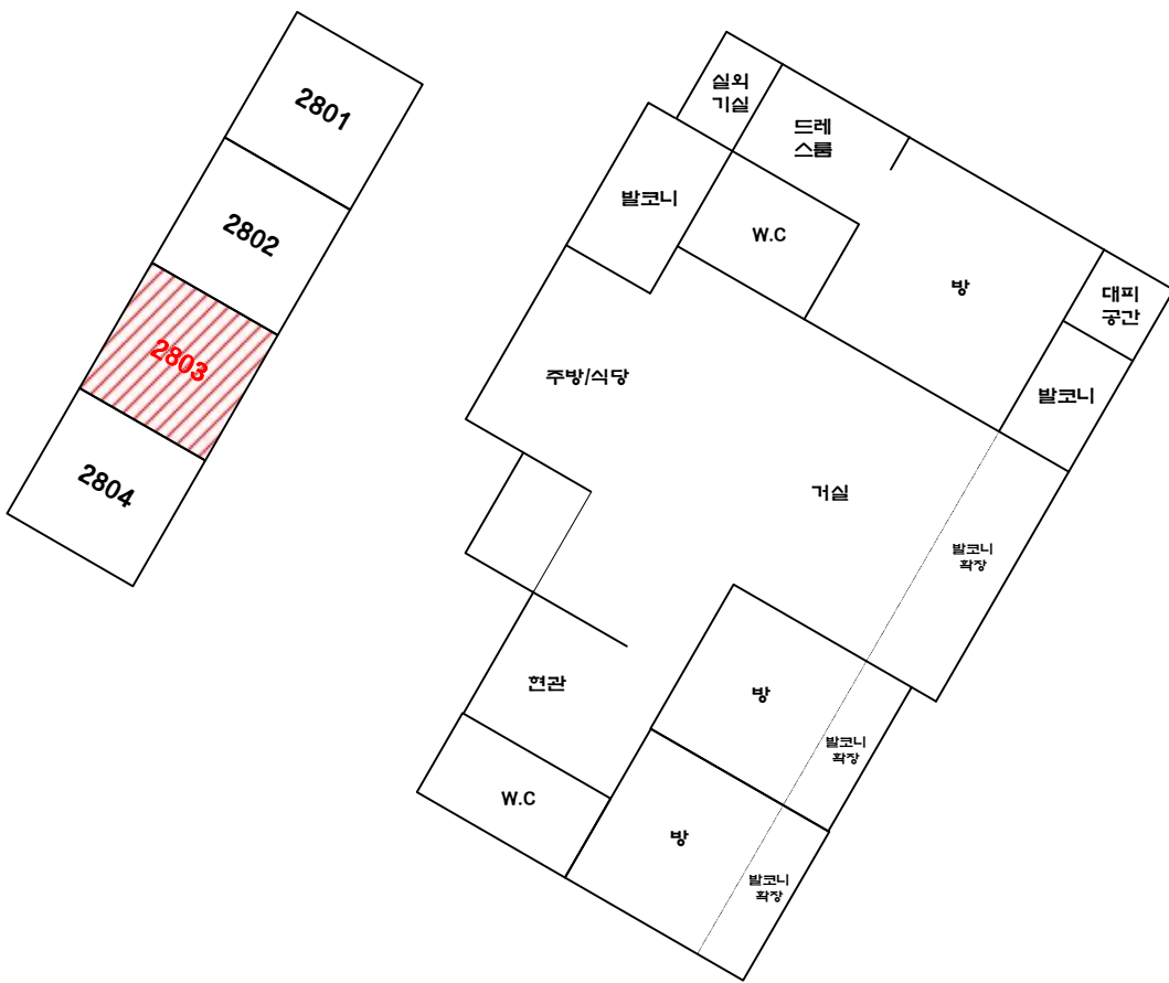
[ 내부구조도 ]