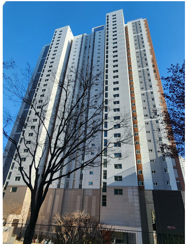
본건동 전경(서측에서 촬영)