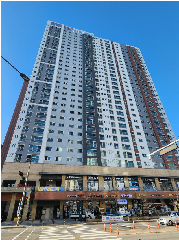
본건동 전경(동측에서 촬영)