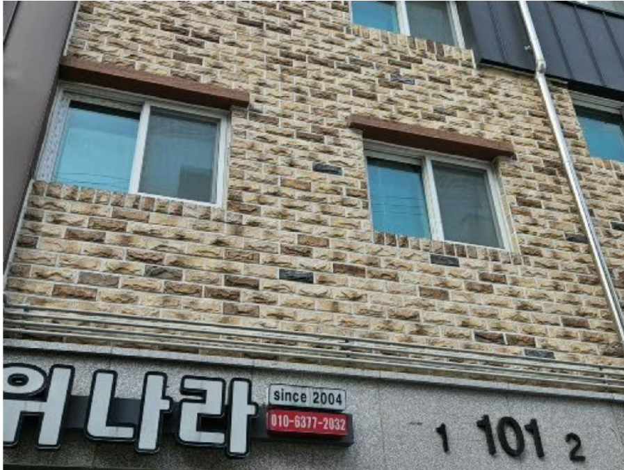
( 2 201 )