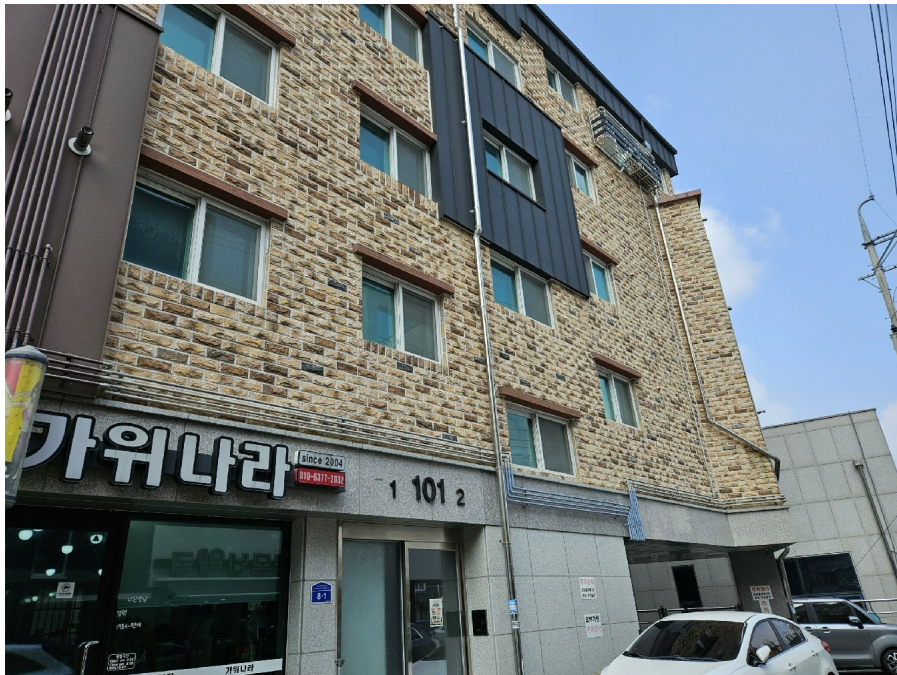
( " 101 )