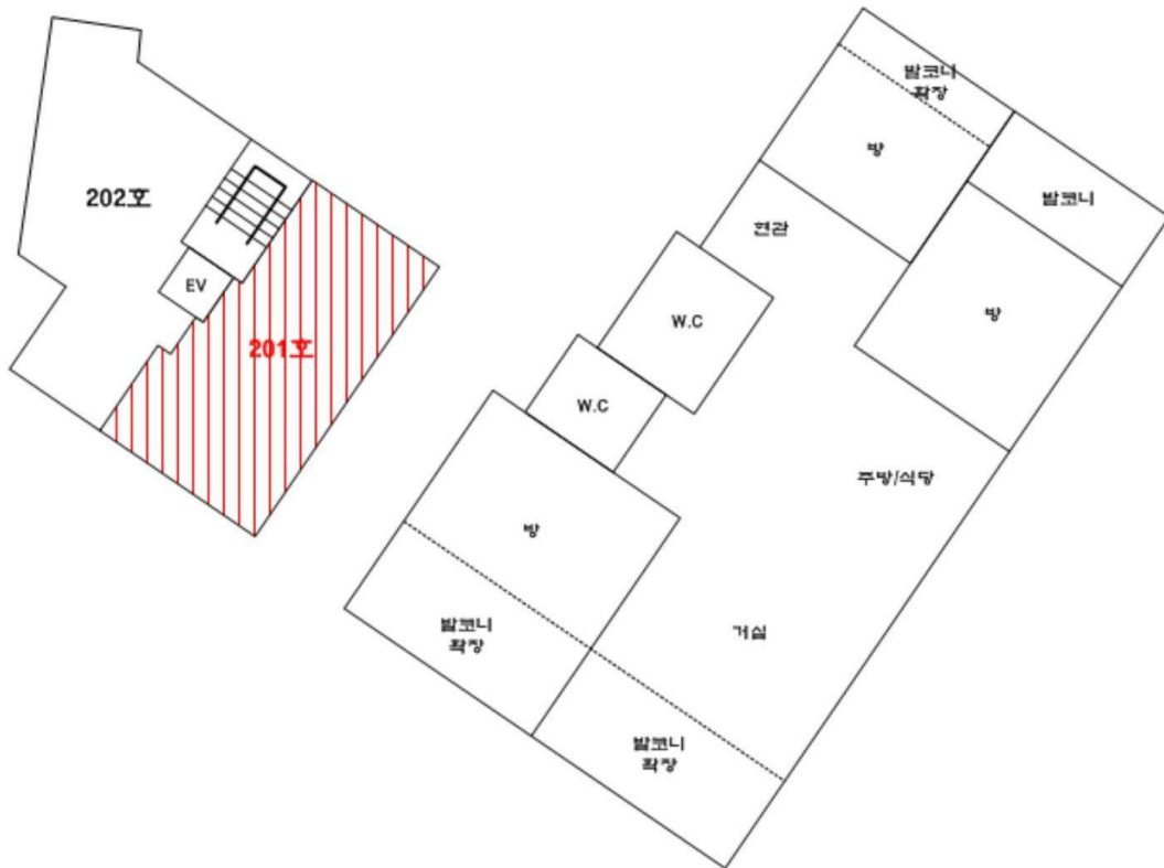
[ 내부구조도 ]