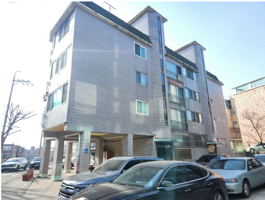
본건 동(통칭 진산그랜드빌라 B 동)