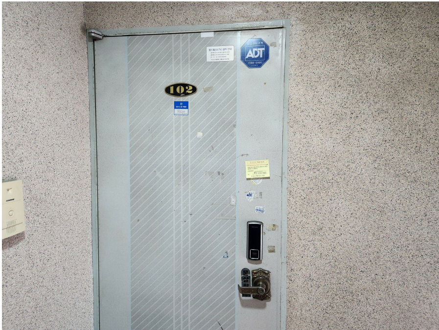
본건 현관 출입문