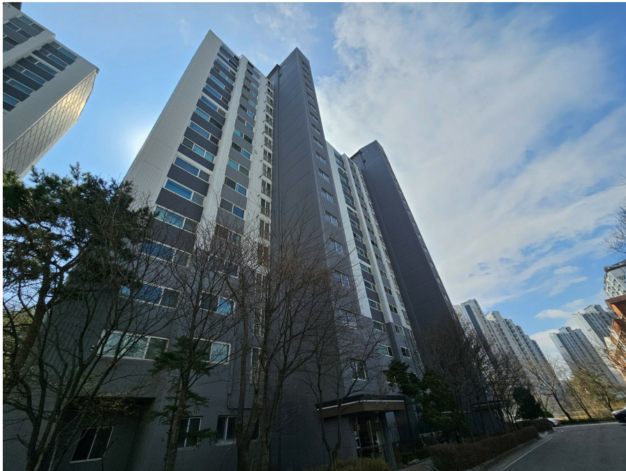
본건 동(평내화성파크힐즈 1703동)