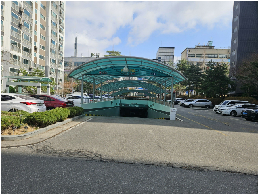
지하 주차장 출입구