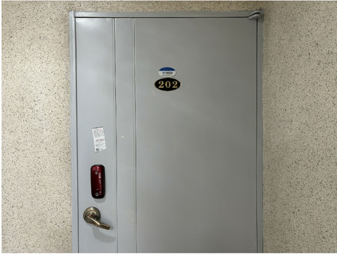
[ 202 ]