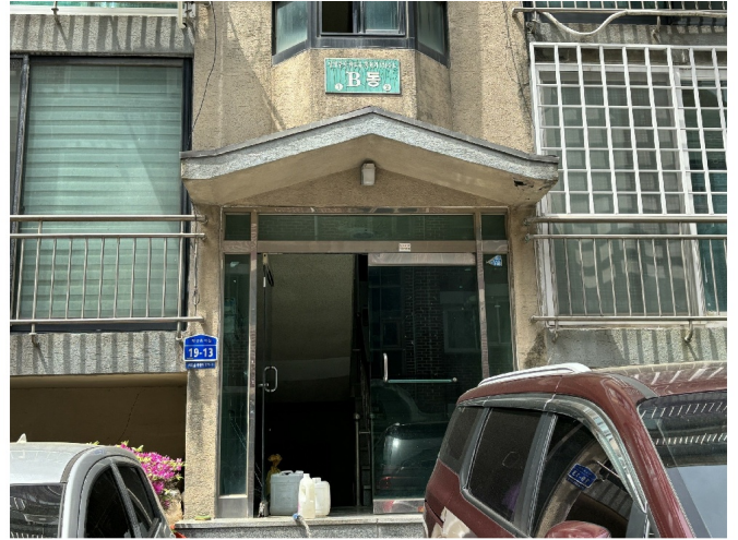
[ 1-2 1 ]