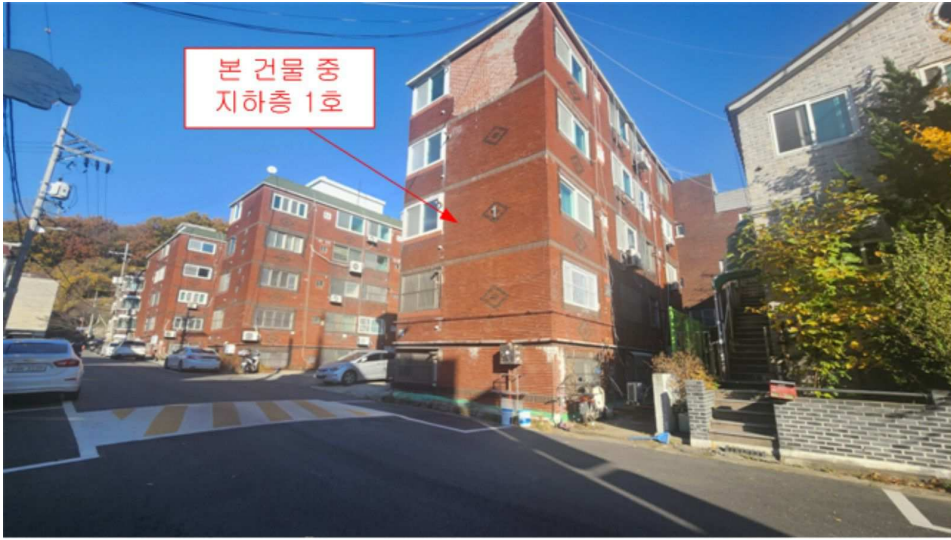
본건 소재 건물 전경