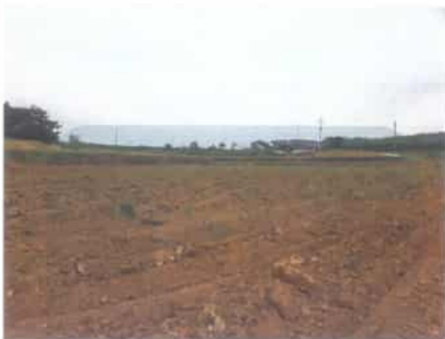
일련번호(1), (2), (5), (6) 풍경