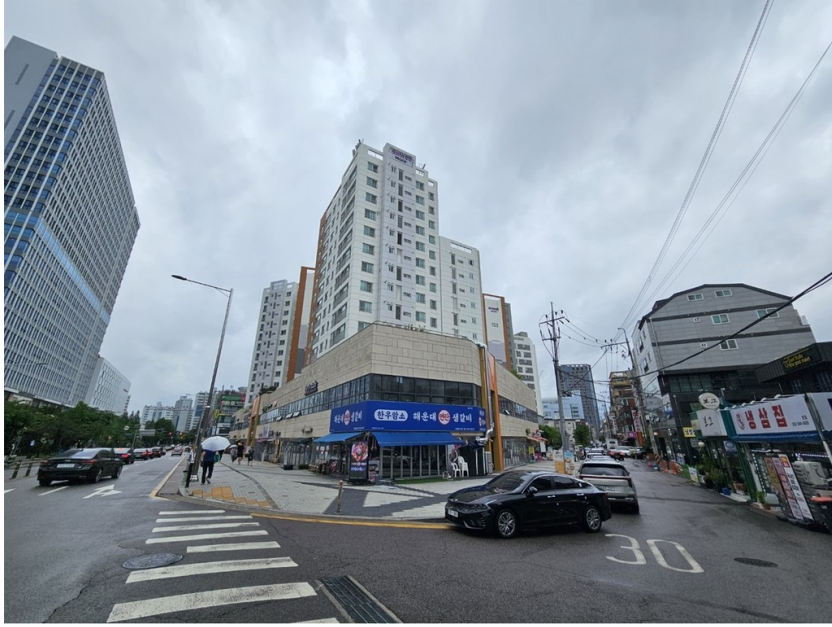
[ 본건 소재 건물 ]