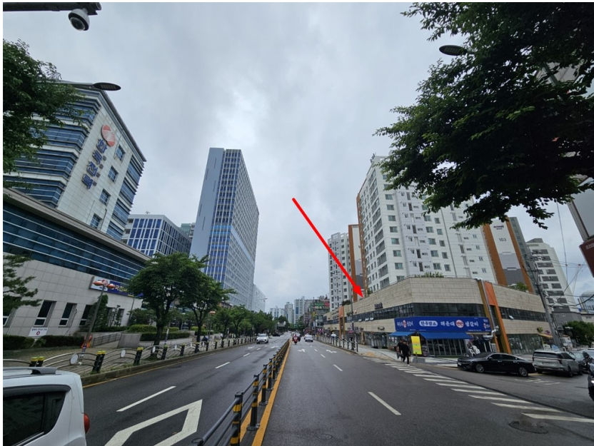
[ 주위 환경 ]