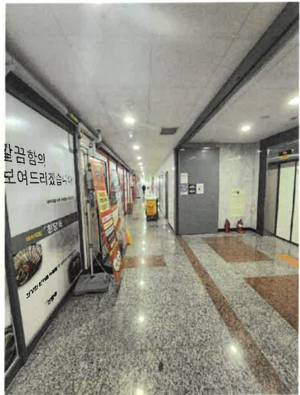
본건 2층 복도