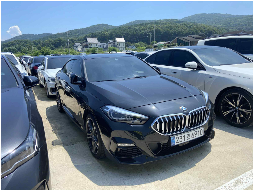
대상물건 전경 (조수석 전면)