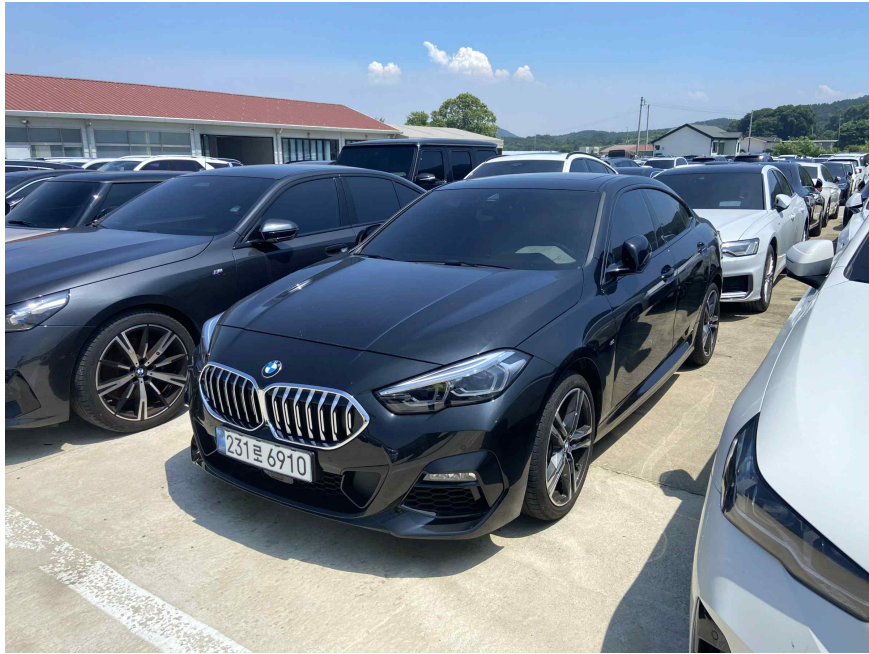
대상물건 전경 (운전석 전면)