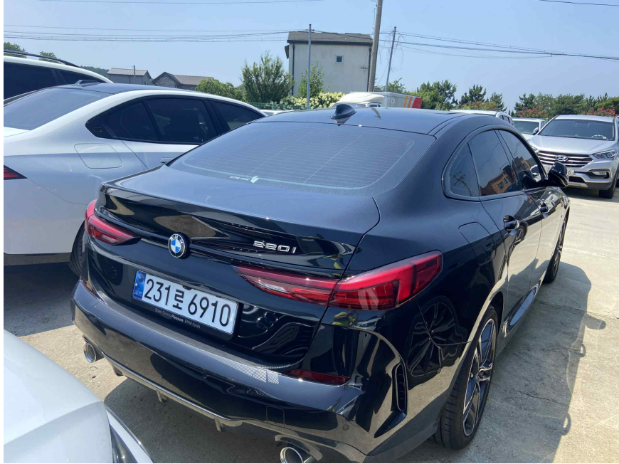
대상물건 전경 (후면)