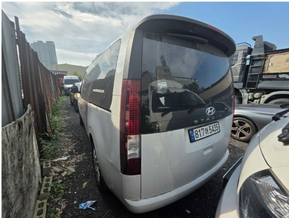
자동차 『 후 면 』