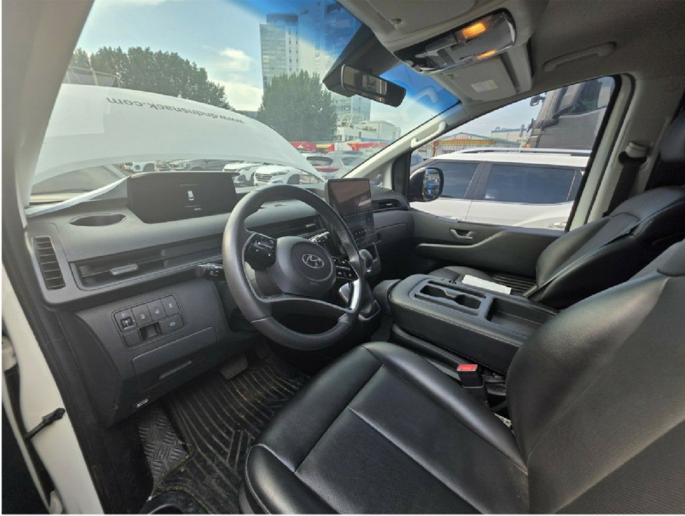
『 운전석 내부 』