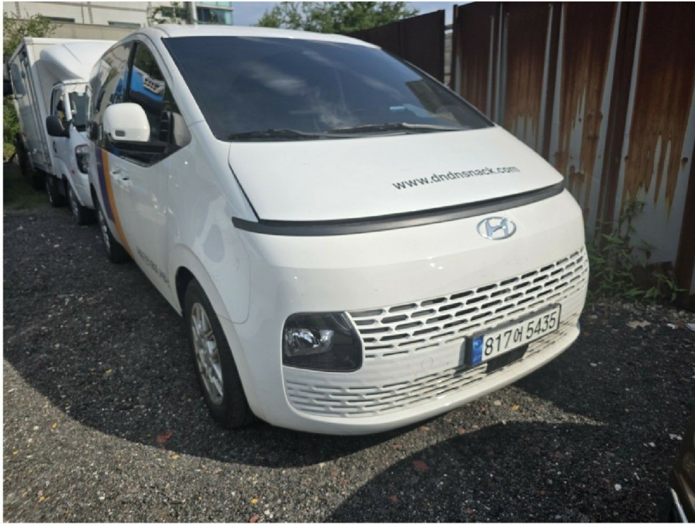
자동차 『 전 면 』