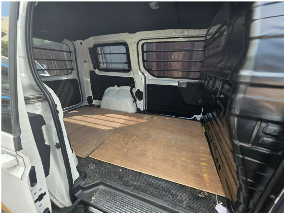
『 화물 적재함 』