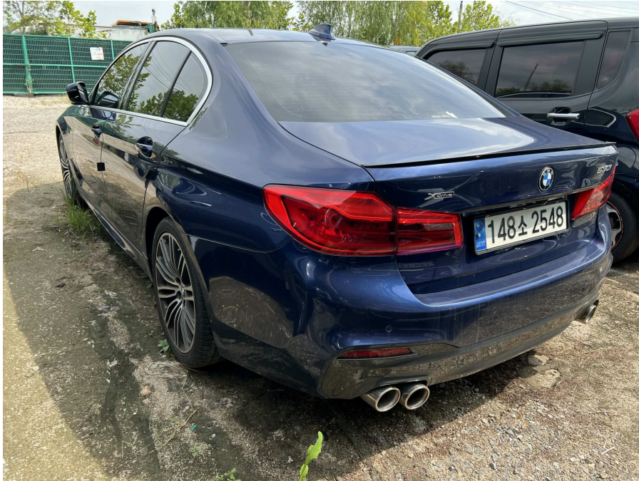
본건 후면부 1