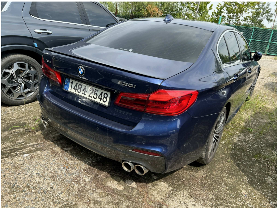
본건 후면부 2