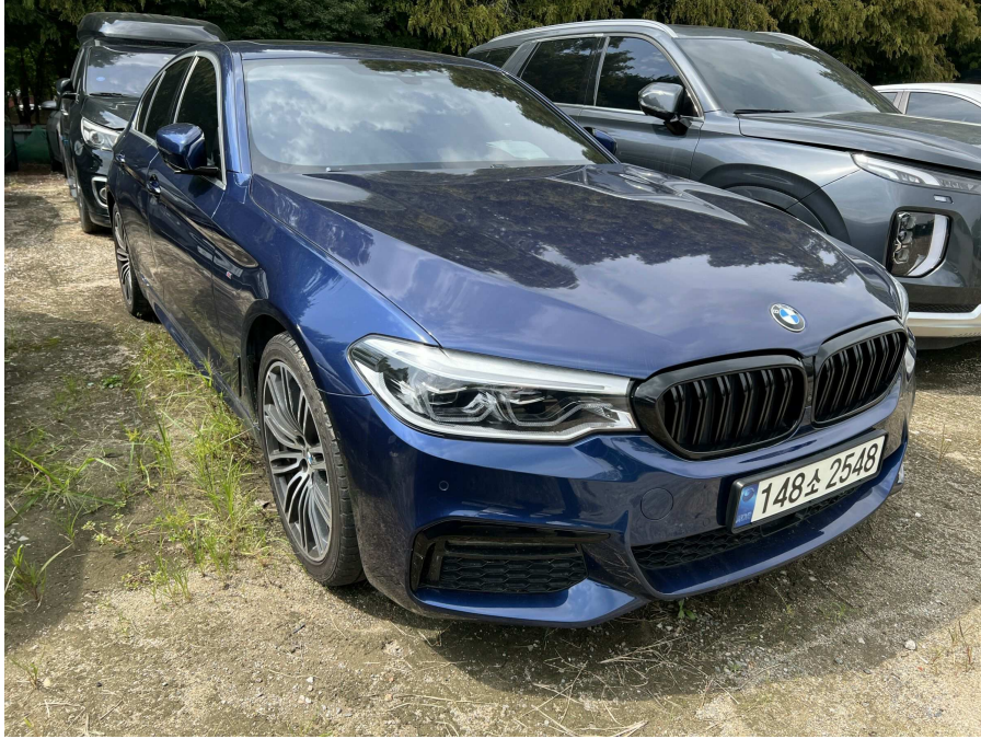
본건 전면부 1