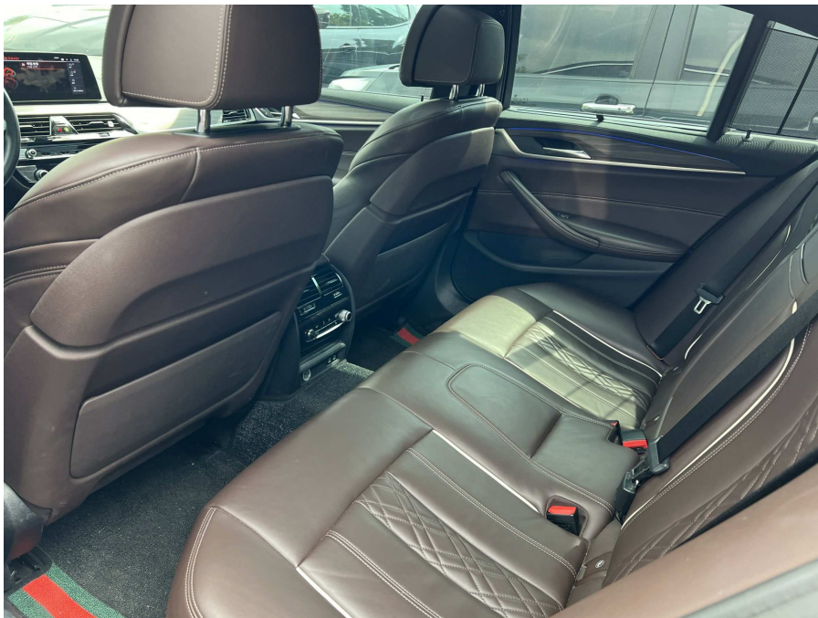
본건 내부 2