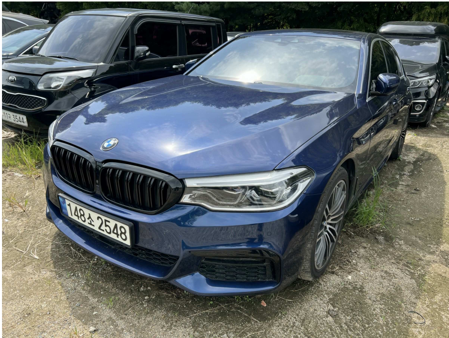
본건 전면부 2