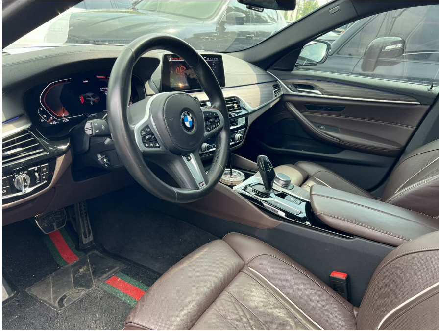
본건 내부 1