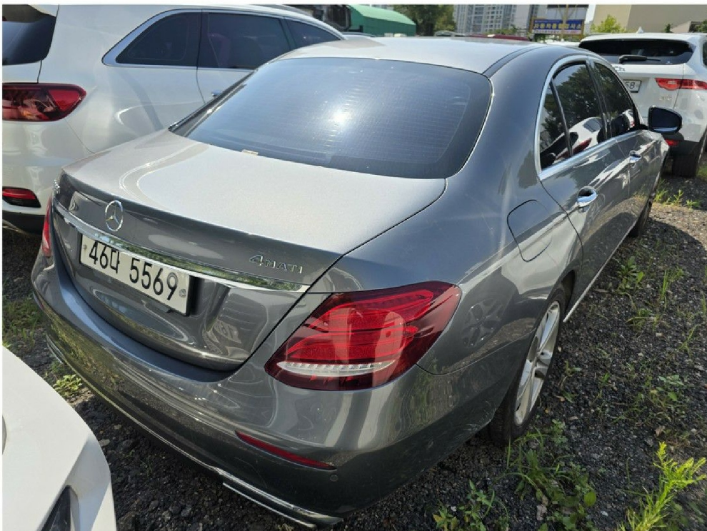
자동차 『 후 면 』