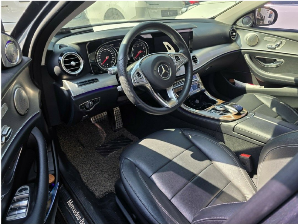
『 운전석 내부 』