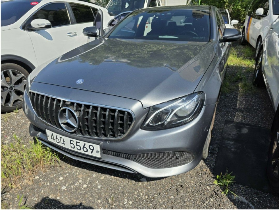
자동차 『 전 면 』