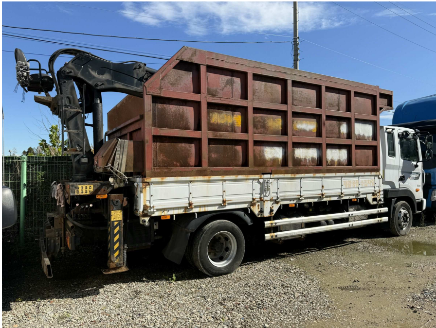
차량 측후면부 부분