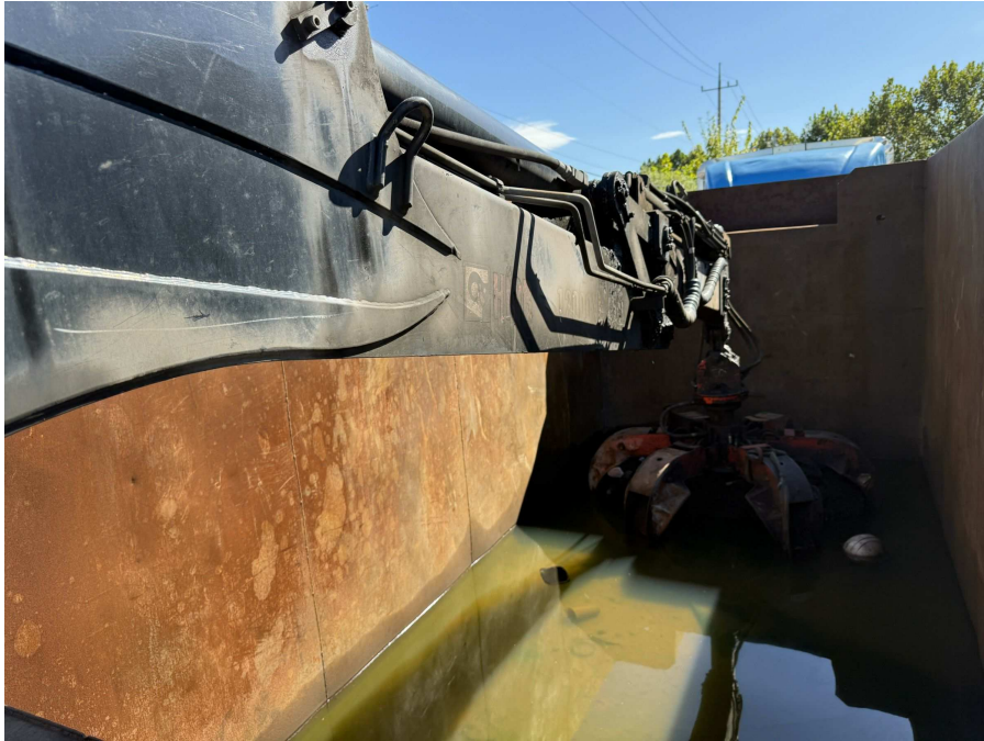
적재함 및 짐게 부분