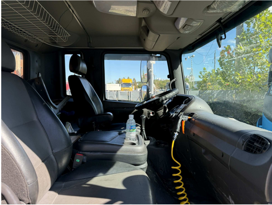
차량 내부 부분