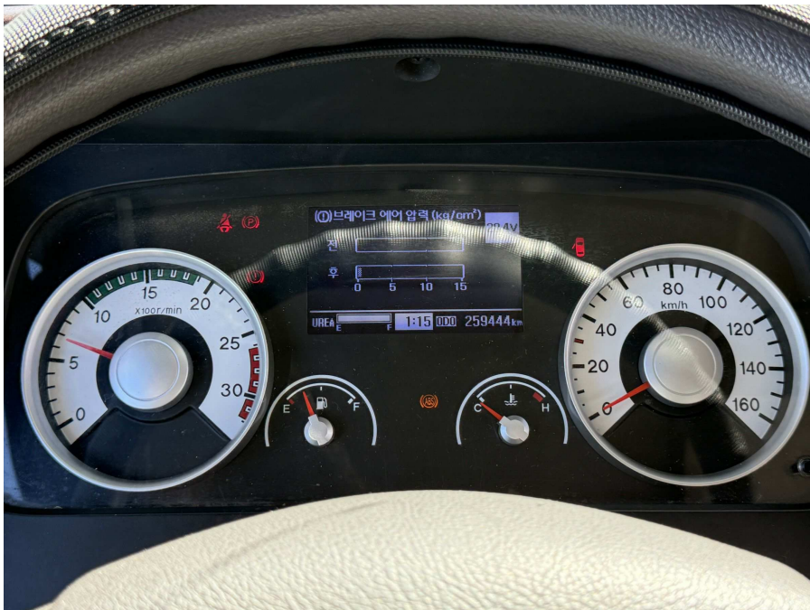
차량 계기판 부분