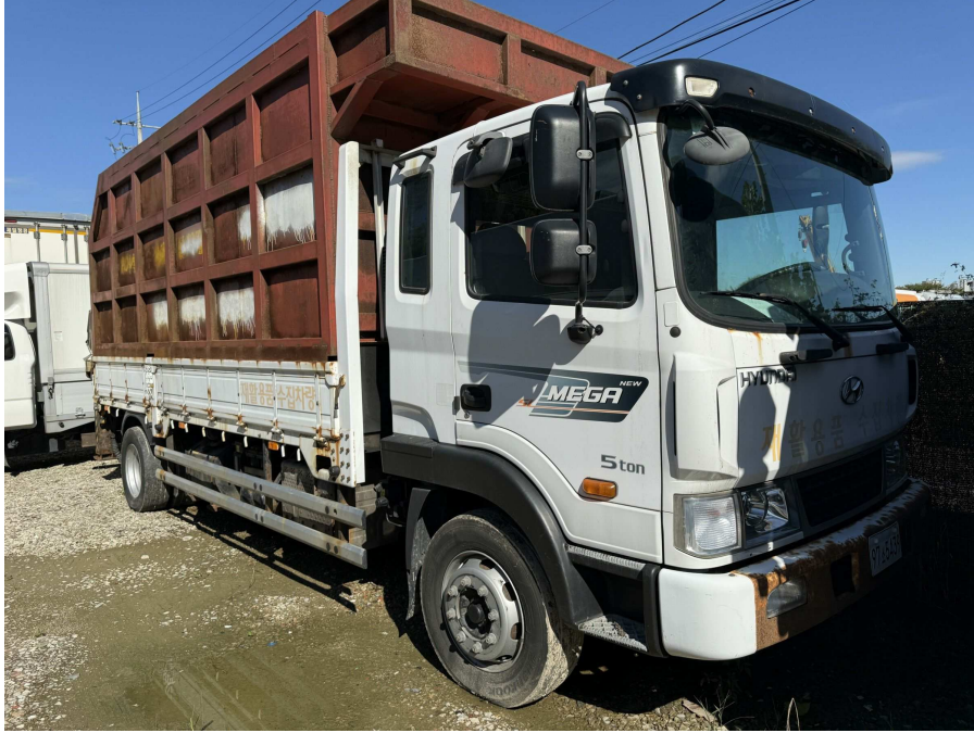
차량 전면부 부분