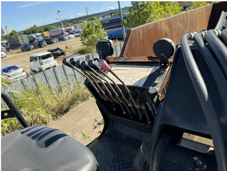
짐게 운전부 부분