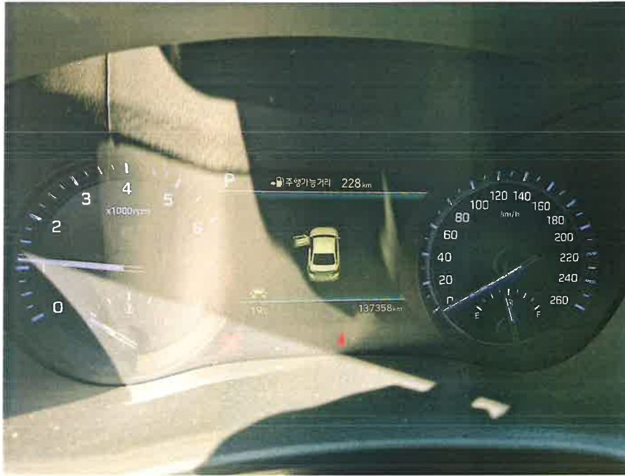
계기판 및 주행거리