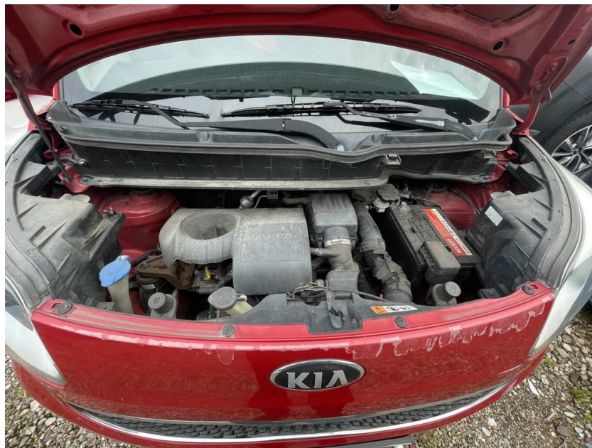
본건 차량 엔진룸