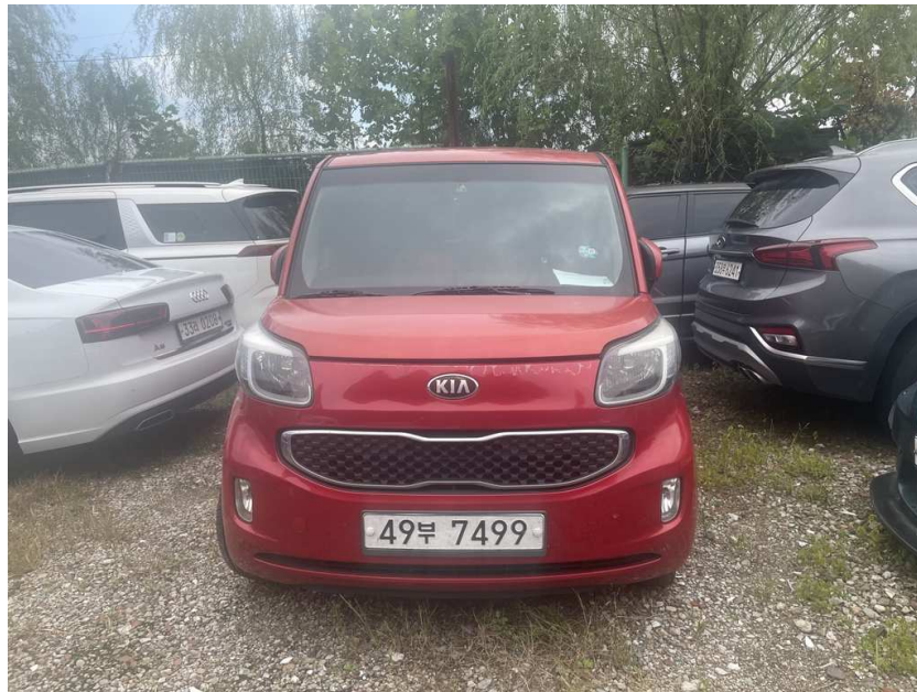
본건 차량 전면