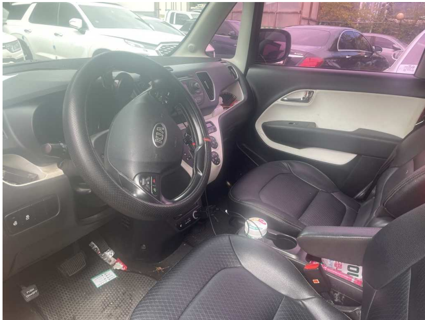
본건 차량 앞좌석