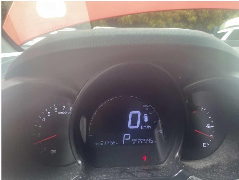
본건 차량 계기판