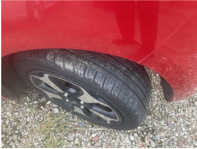
본건 차량 타이어 상태