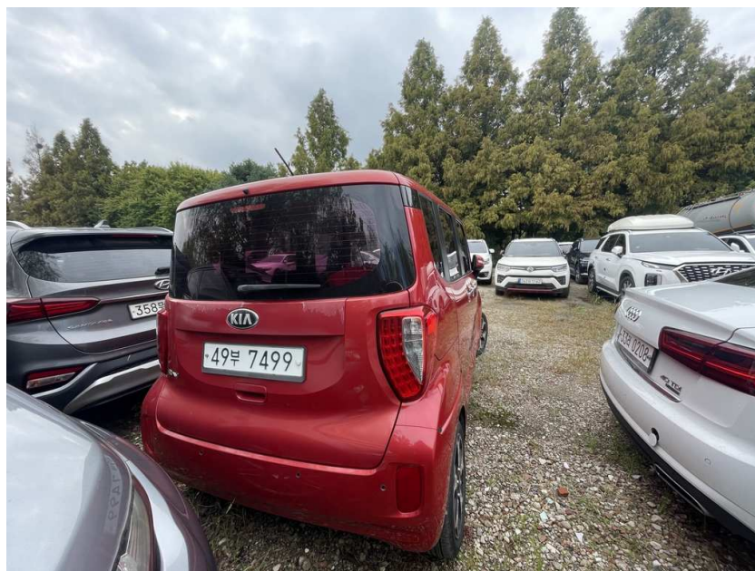
본건 차량 후면