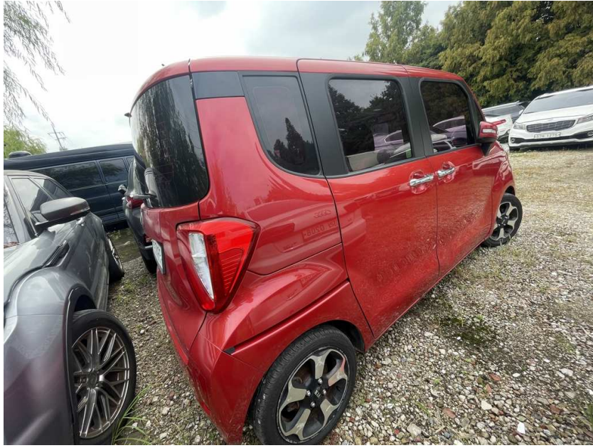
본건 차량 옆면