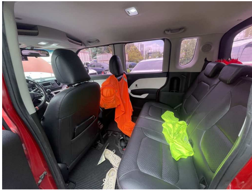
본건 차량 뒷자석