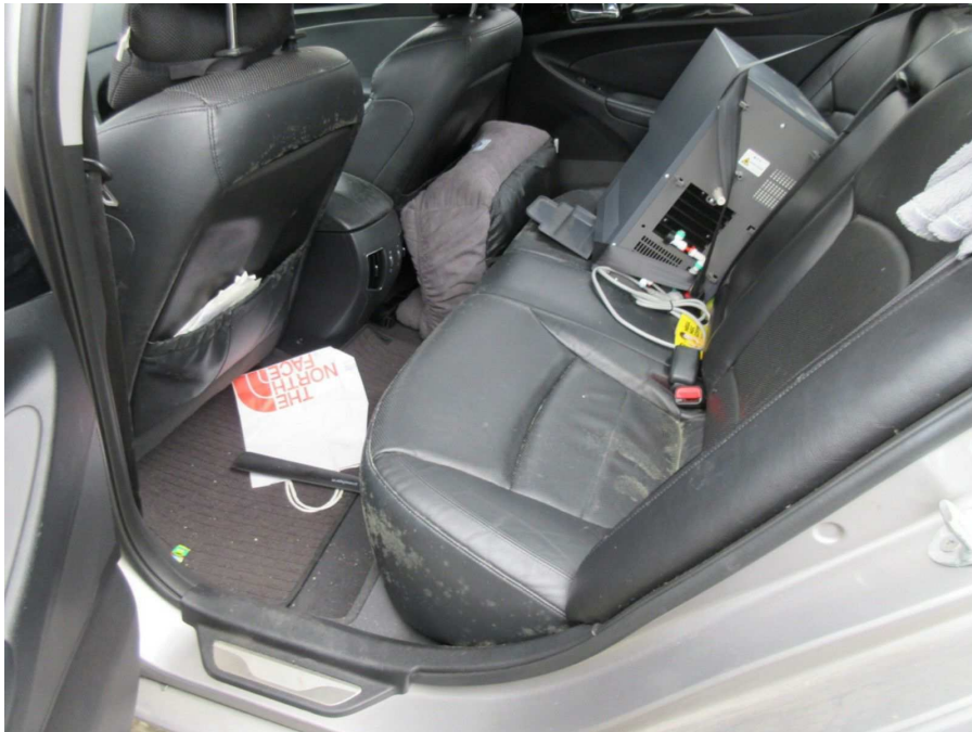
내부 시트 오염