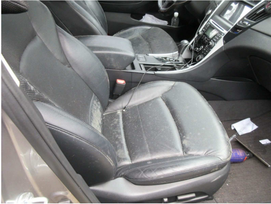
내부 시트 오염