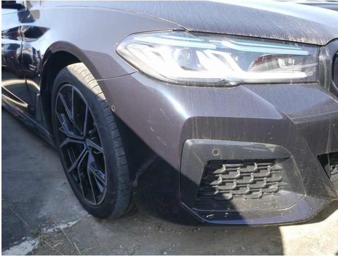
우측 전면부 범퍼 및 바퀴