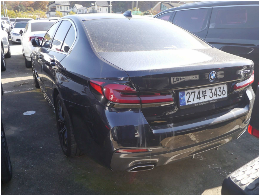
차량 좌측 후면부