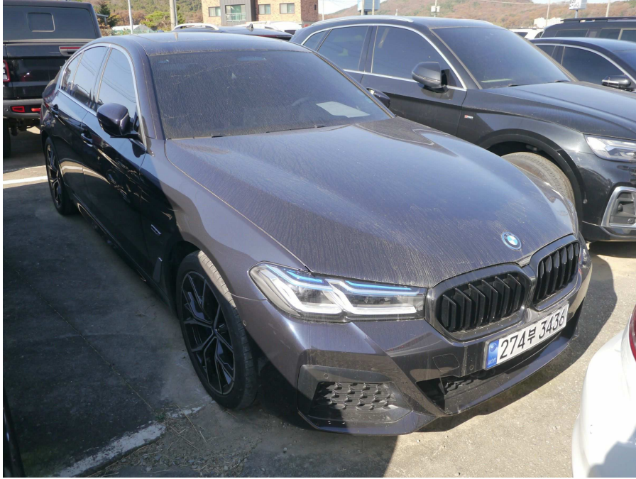
본건 차량 우측 전면부