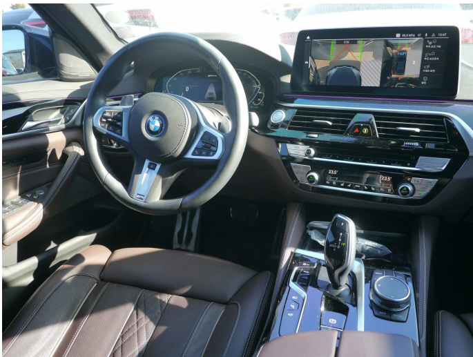
차량 내부 모습