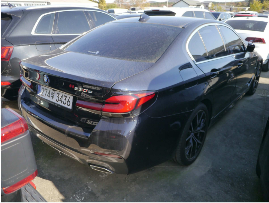
차량 우측 후면부