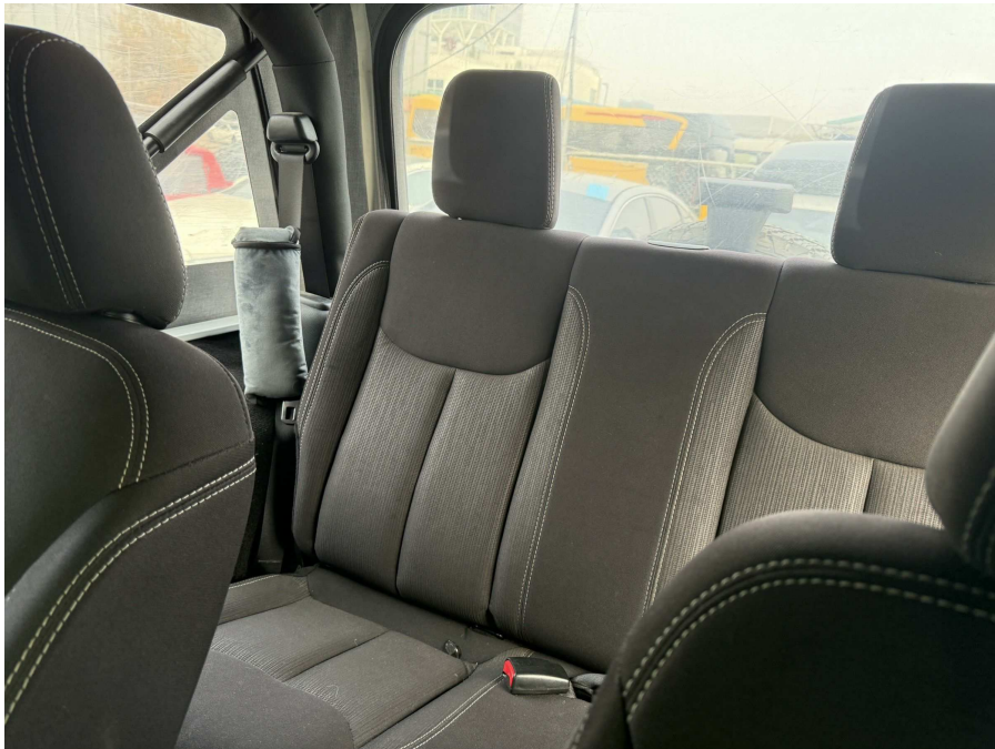
본건 내부 2