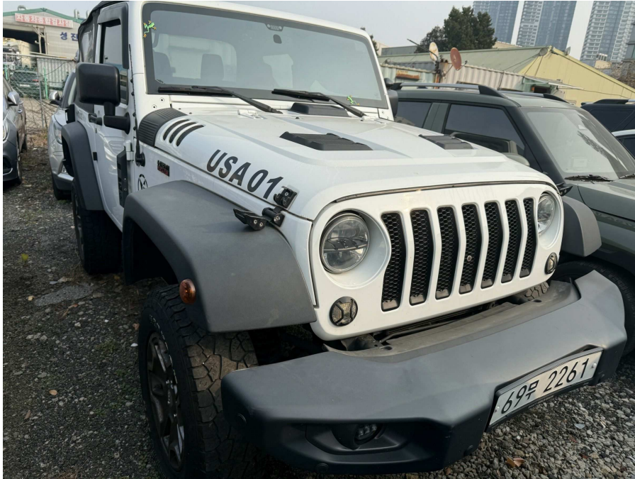
본건 전면부 1