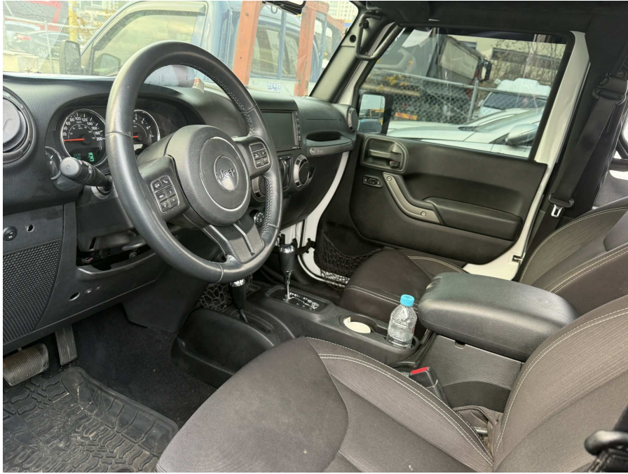
본건 내부 1