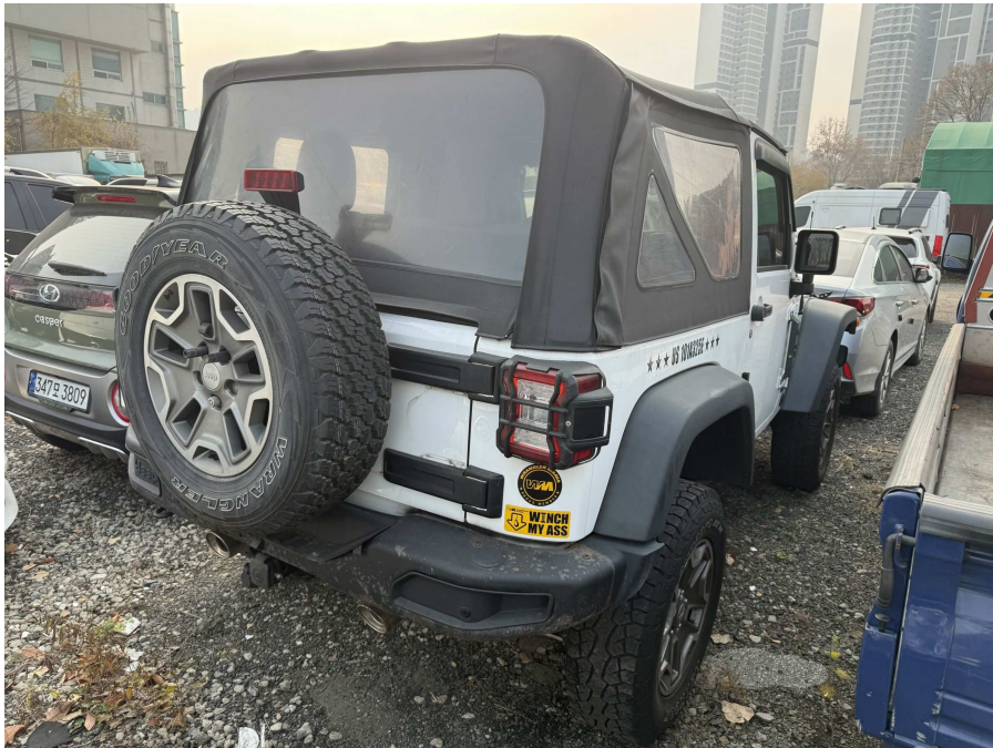
본건 후면부 2