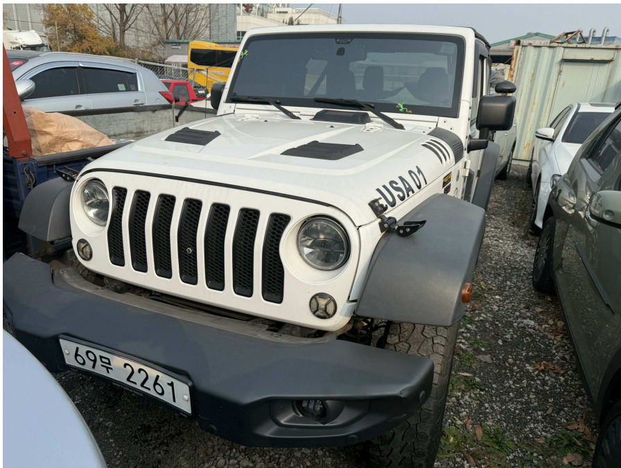
본건 전면부 2