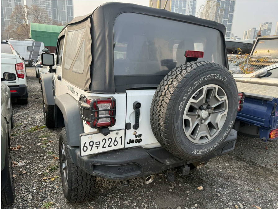
본건 후면부 1