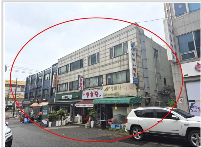
본건 지상 소재 건물