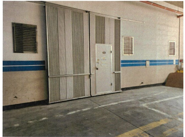
본 건 입 구