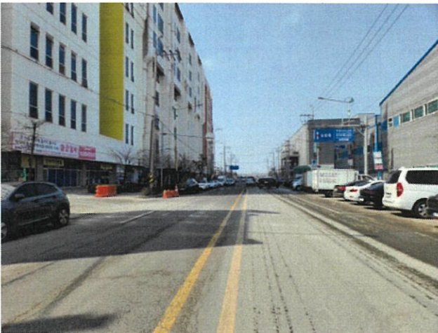
인 접 도 로