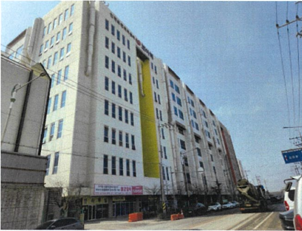
본 건 전 경