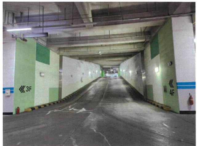
주 차 통 로