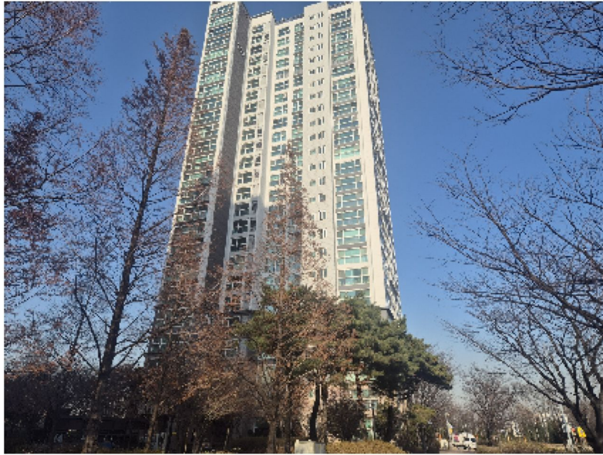
【 대상물건 전경 】