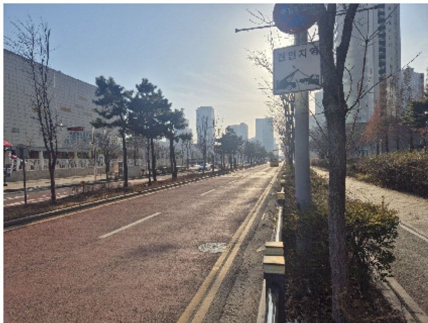
【 대상물건 주변전경[남동측 인근도로] 】