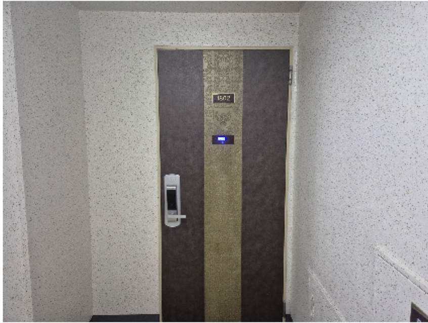
【 대상물건 내부전경2[복도에서 촬영] 】