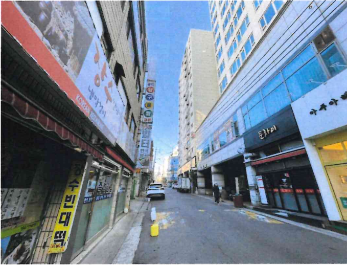
본건 남서측에서 촬영