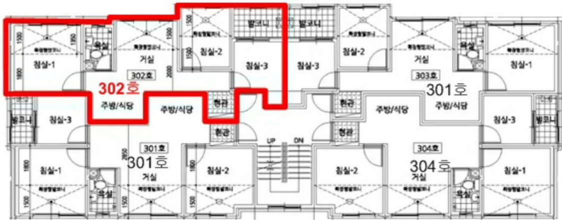
본건 [ 자연마을 3층 302호 ]