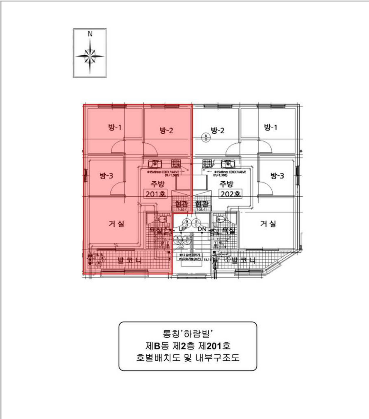
통칭 '하람빌' 제B동 제2층 제201호 호별배치도 및 내부구조도