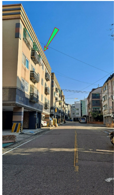
( 101 )