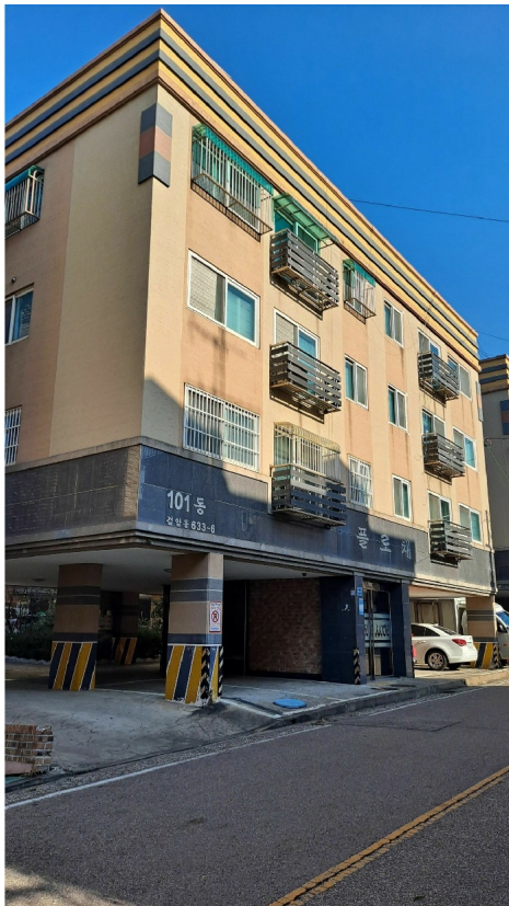
( 101 ) :