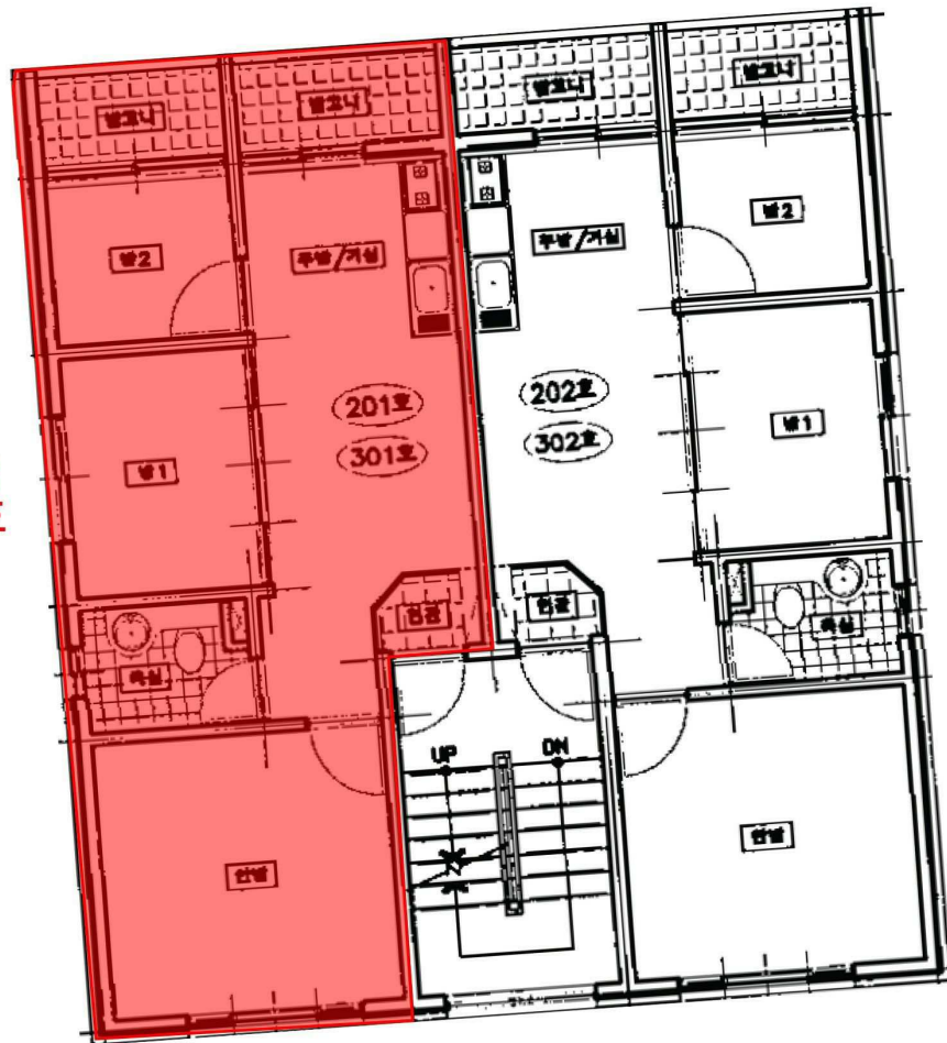
<우주파크빌 제비동 제3층 호별배치도>