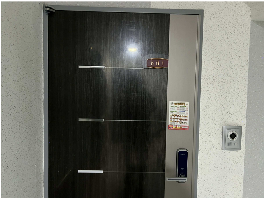
본건 외부 현황