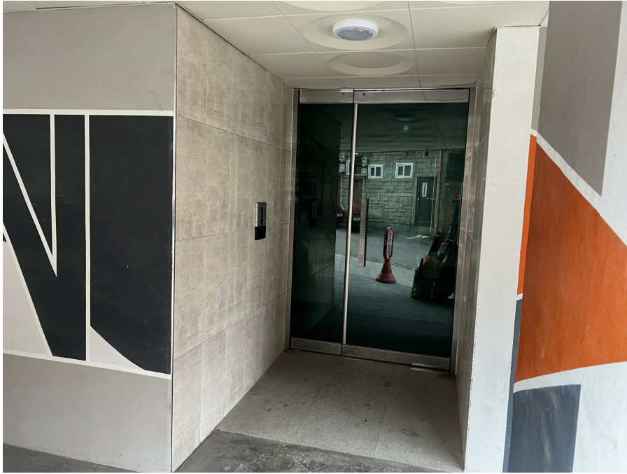
1층 출입부 현황