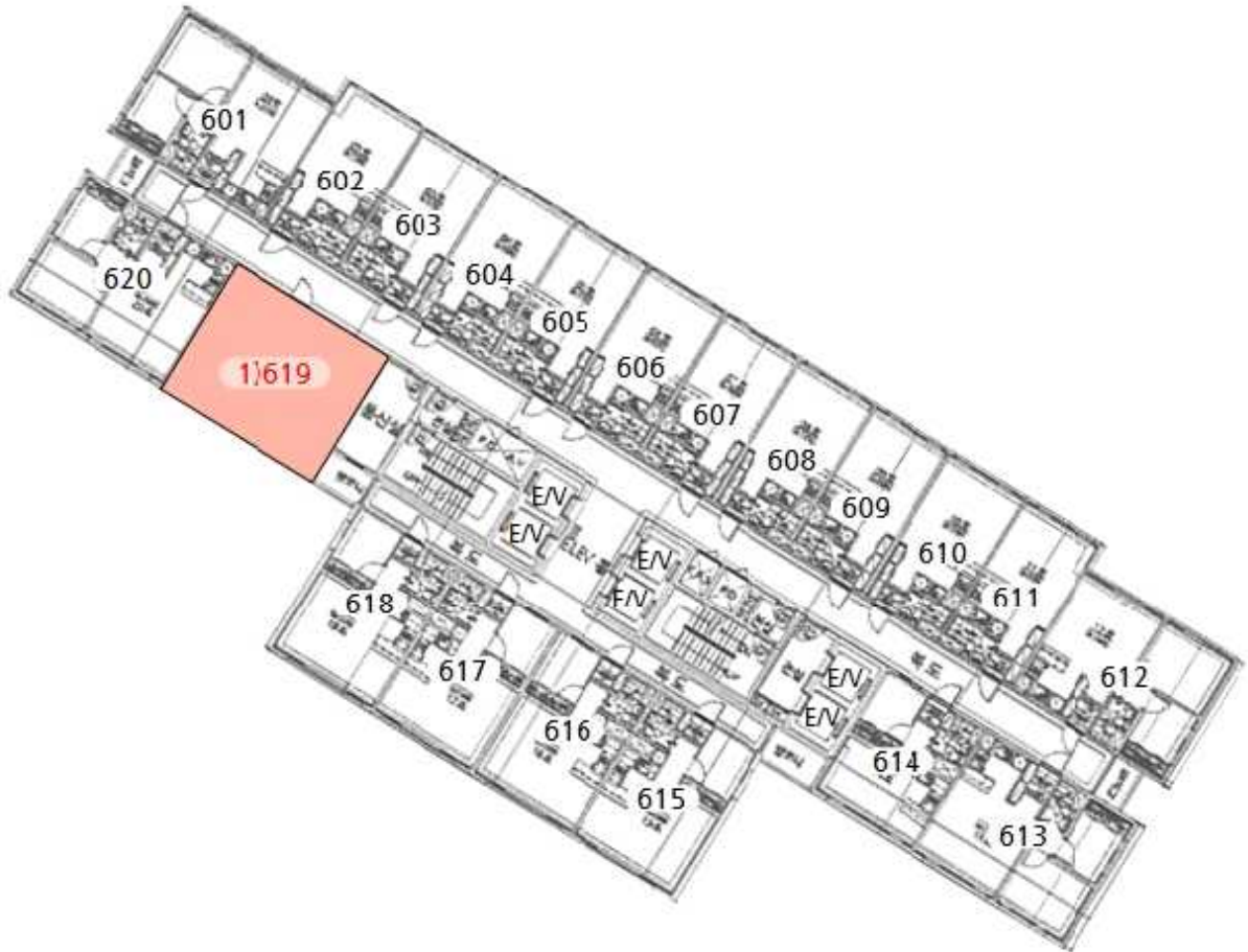
본건 1) [ 제6층 제619호 ]