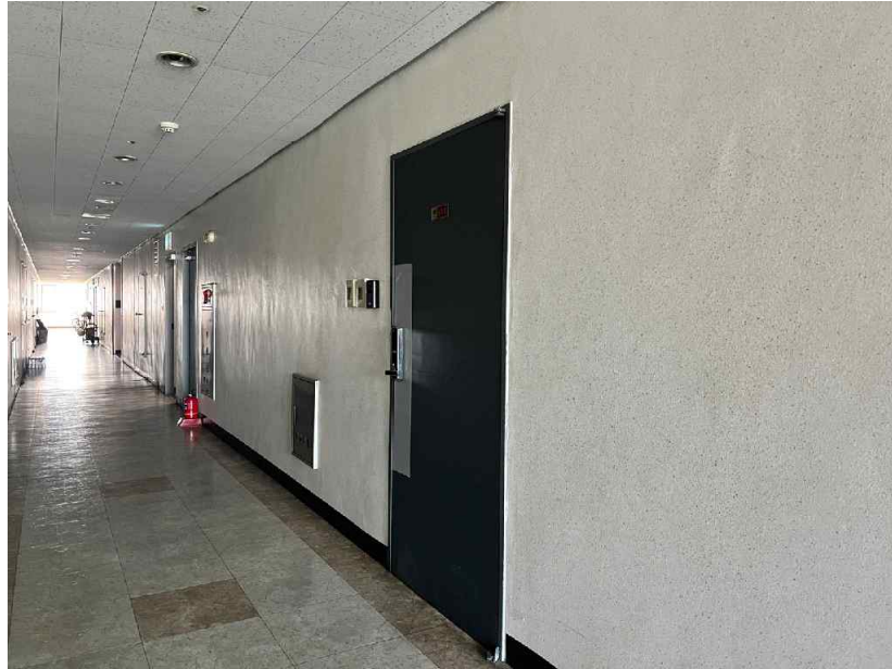
대상물건 전경[복도에서 촬영]