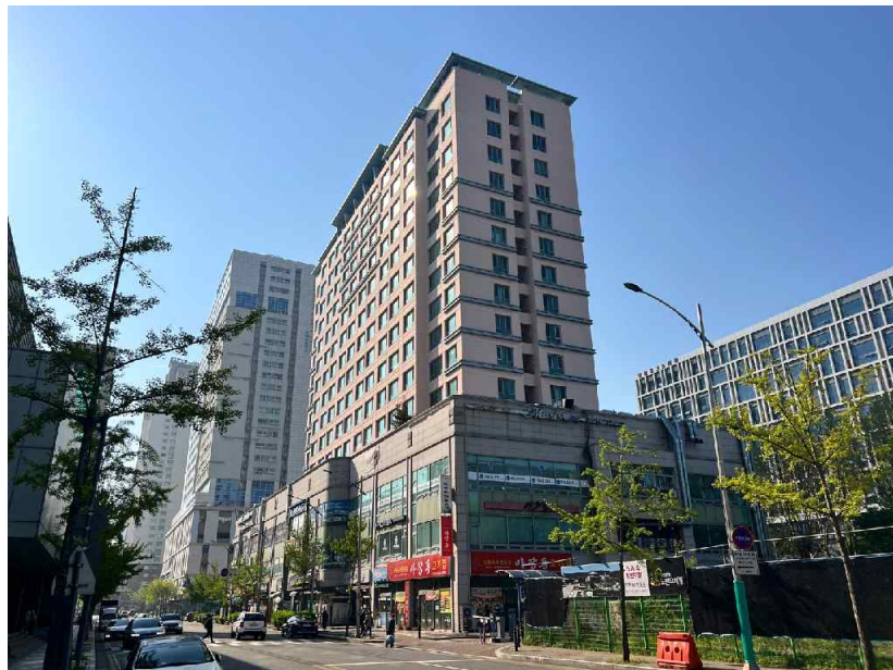
대상물건 전경[북서측에서 촬영]