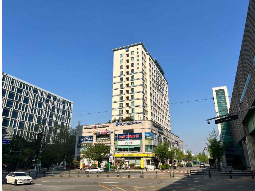
대상물건 전경[북동측에서 촬영]