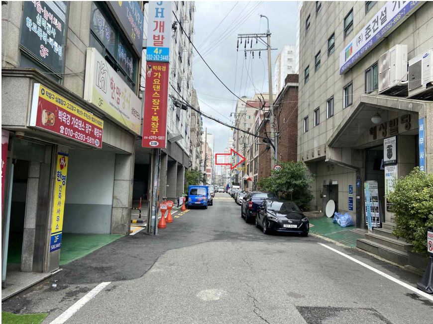
주위환경 (북측에서 촬영)