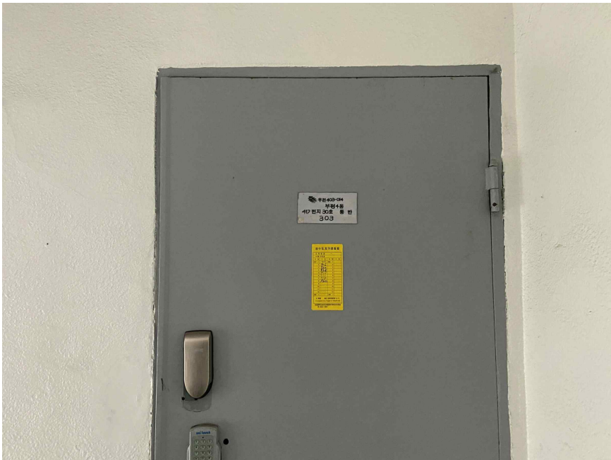
대상물건 출입문 (303호)