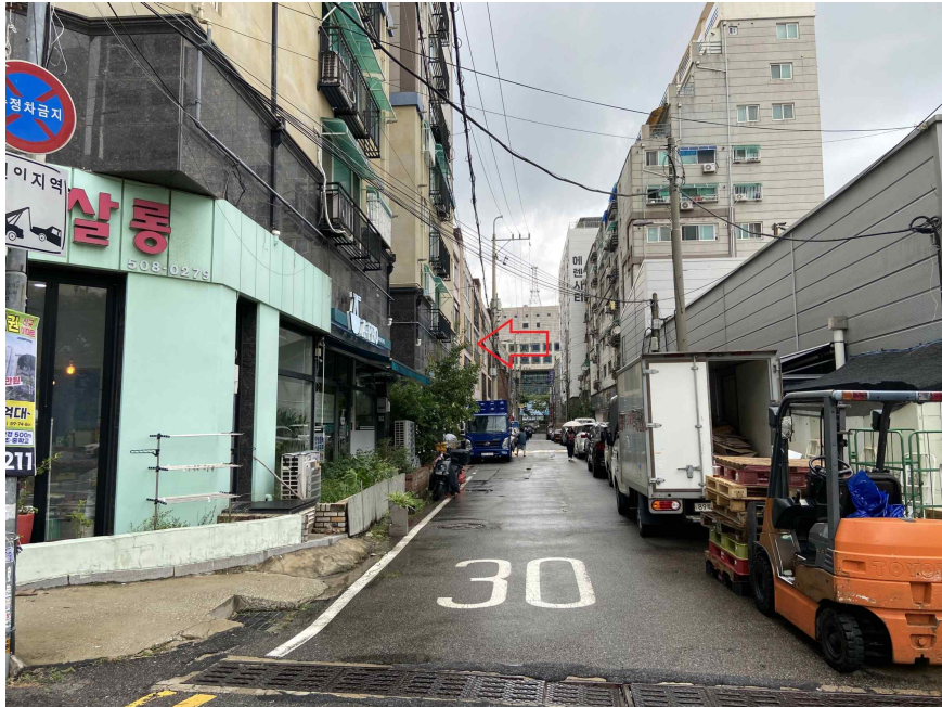
주위환경 (남측에서 촬영)