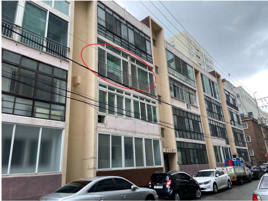
대상물건 전경 (남동측에서 촬영)