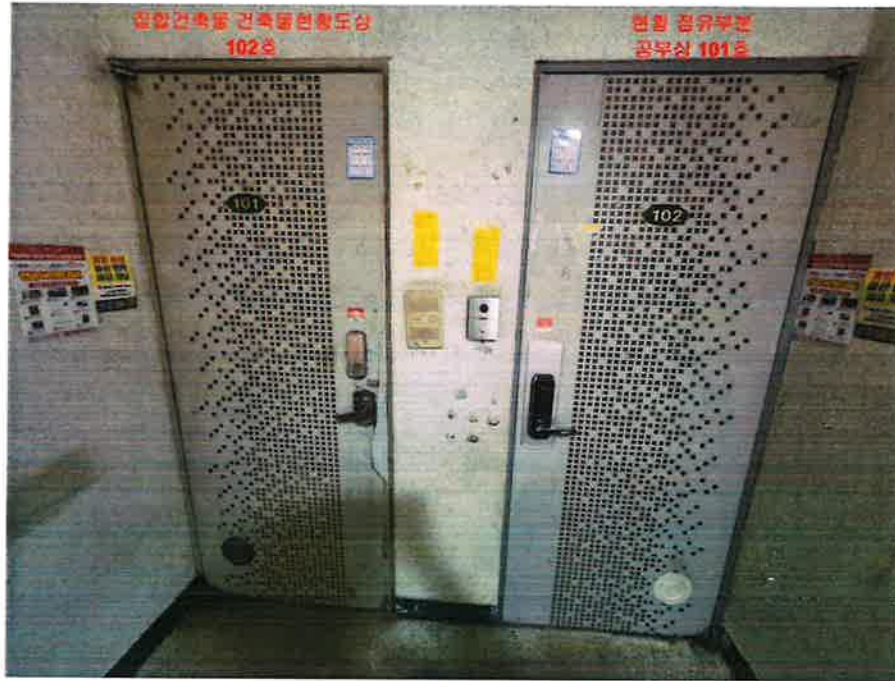
본건 현관 출입구 전경