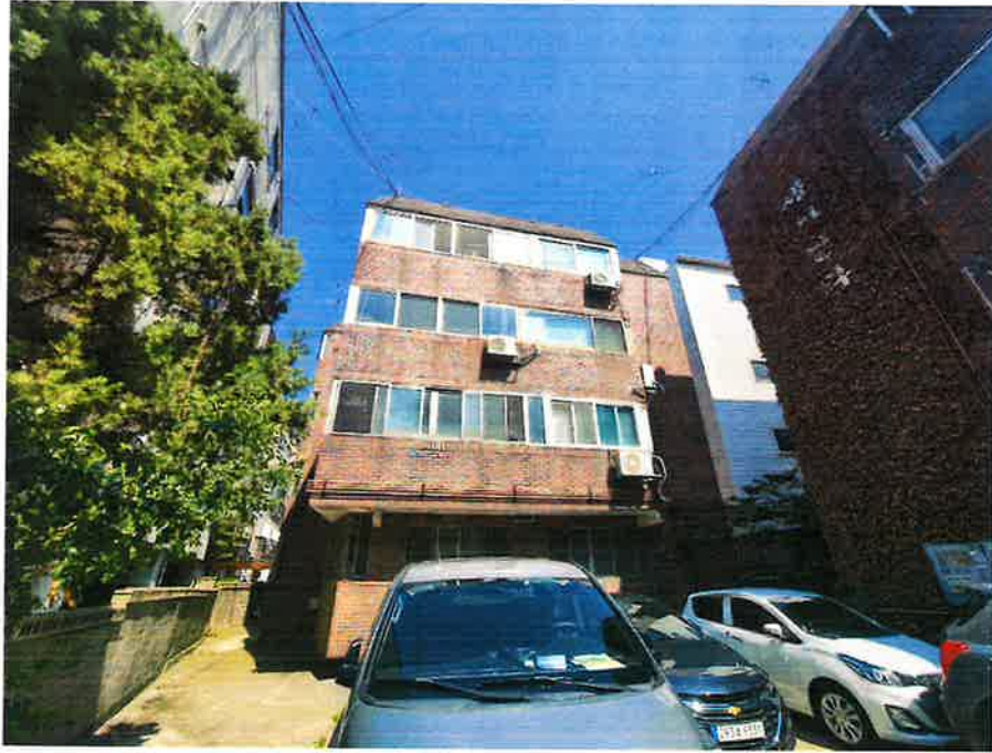
본건 소재 건물 전경