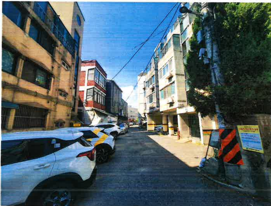
인접도로 및 인근 전경