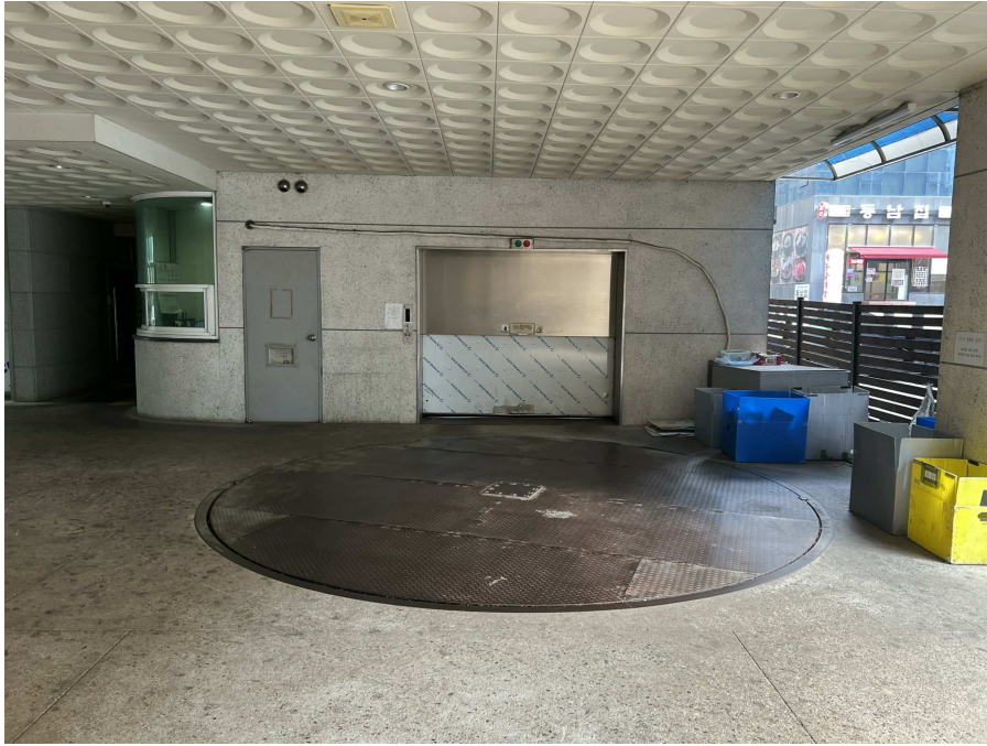
기계식주차설비 부분 2