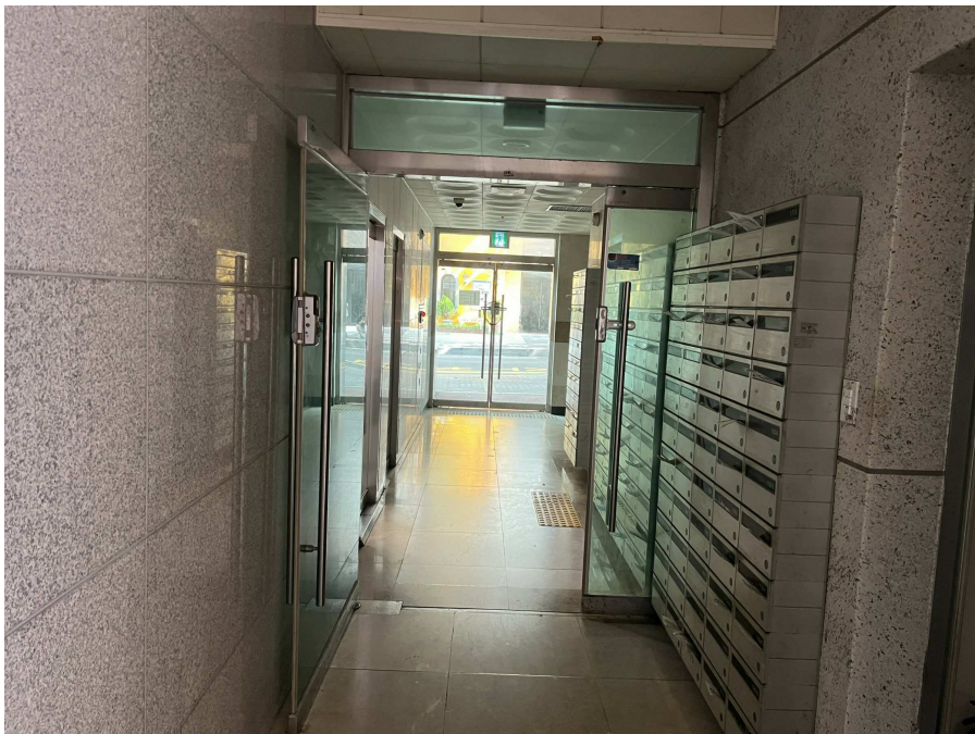
1층 출입부 현황