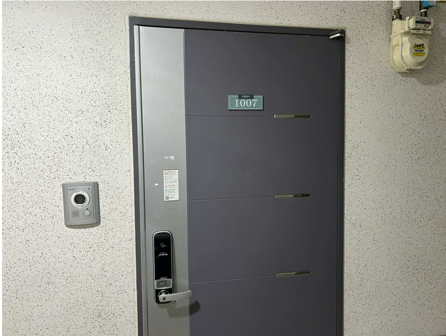
본건 외부 현황