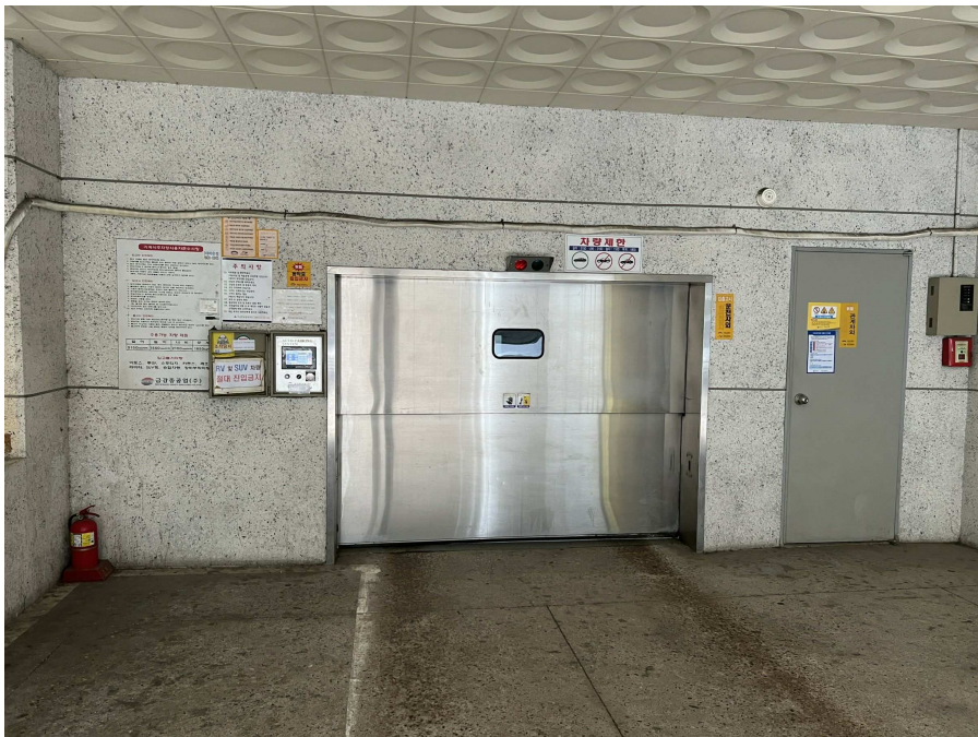
기계식주차설비 부분 1