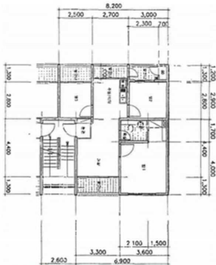
< 501호 내부구조도 >