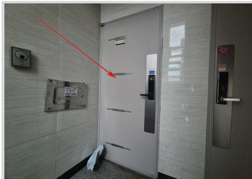
본건 현관문 사진