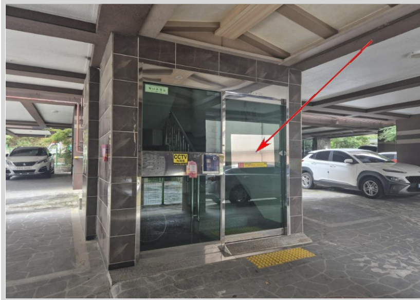
공동 현관문 사진