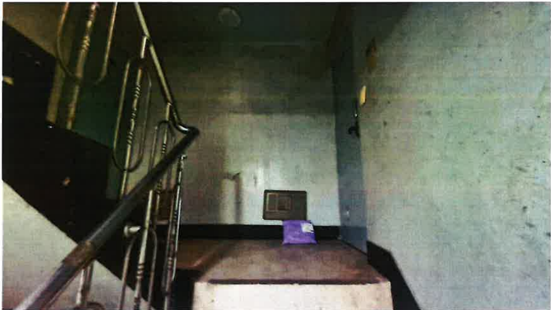
좌(표식201 도면202), 우(표식202 도면201)