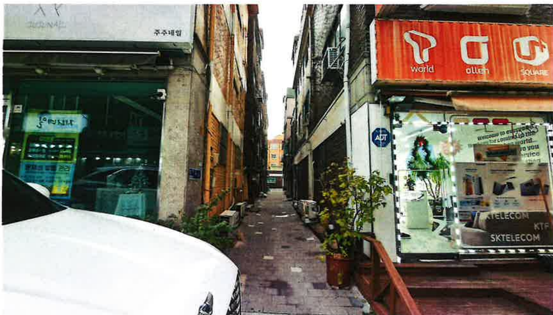
진입로 및 주위환경