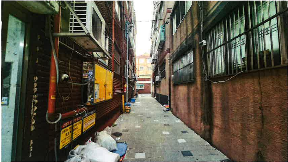
통로 및 주위환경