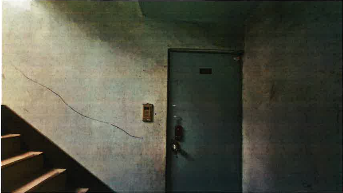
201호(표식201호 도면상 202호)