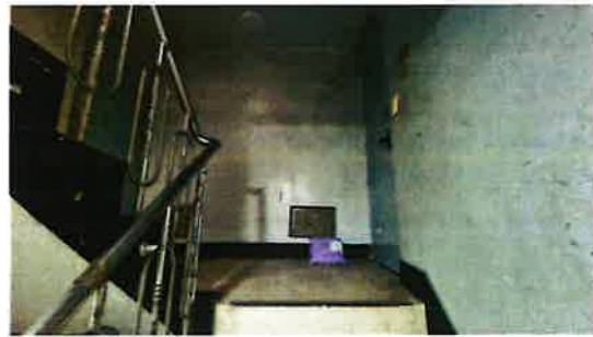
대상건물(통칭 "덕성빌라 비동")