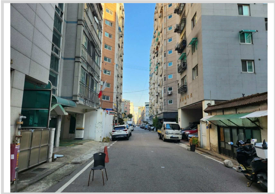
남측 도로변 전경