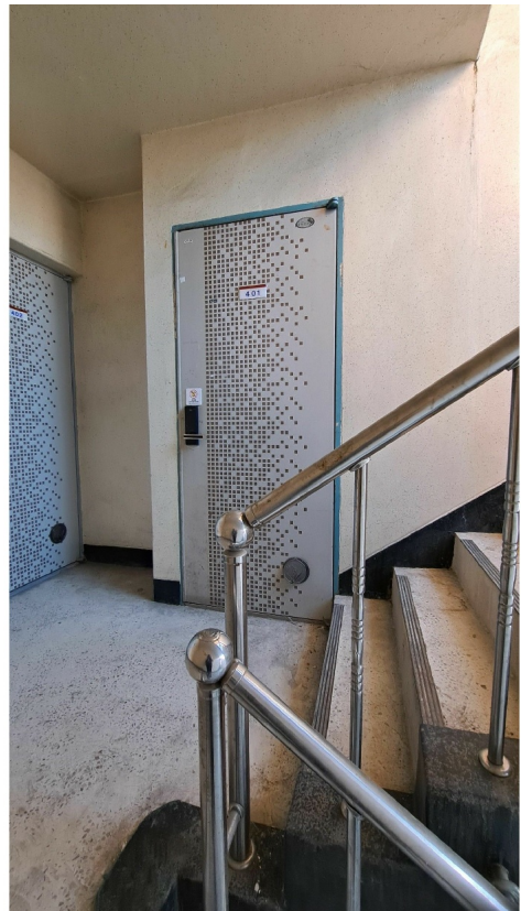
( 401 )