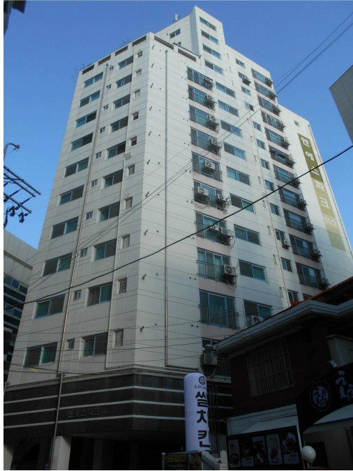
본건 전경1(남서측 인근에서 촬영)