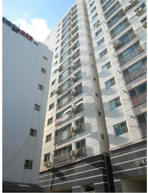
본건 전경2(남동측 인근에서 촬영)