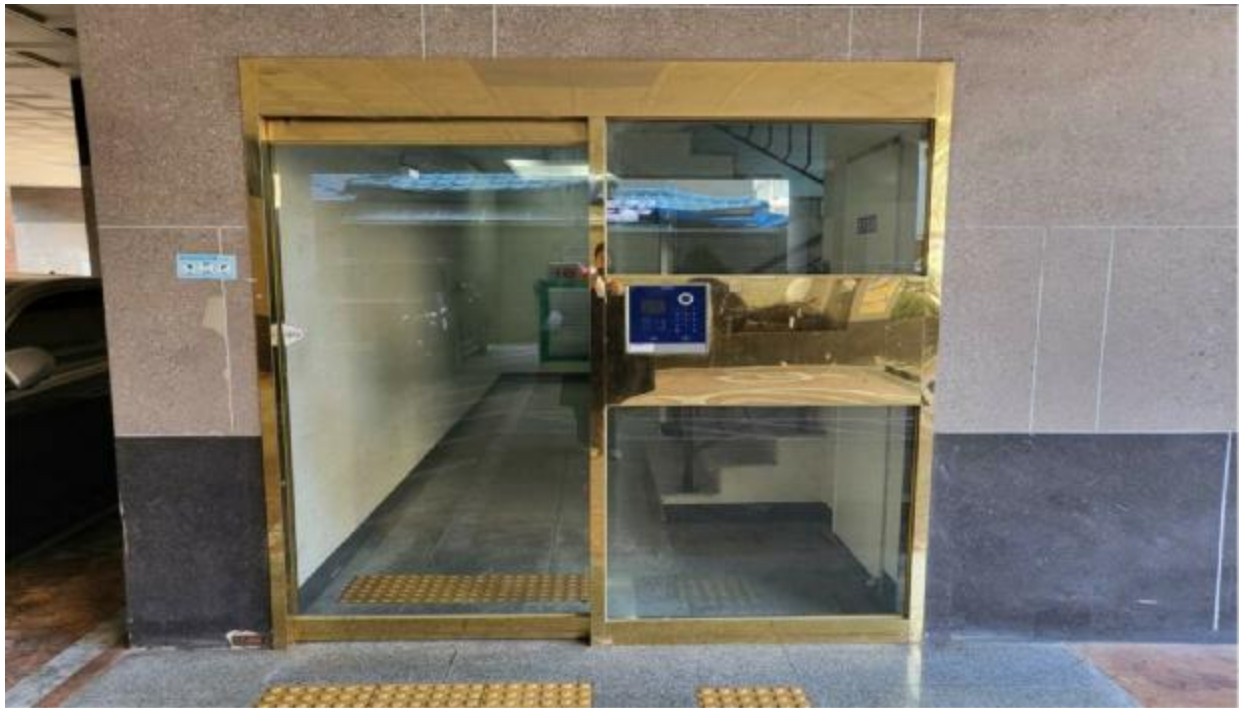
본 건 출입 구