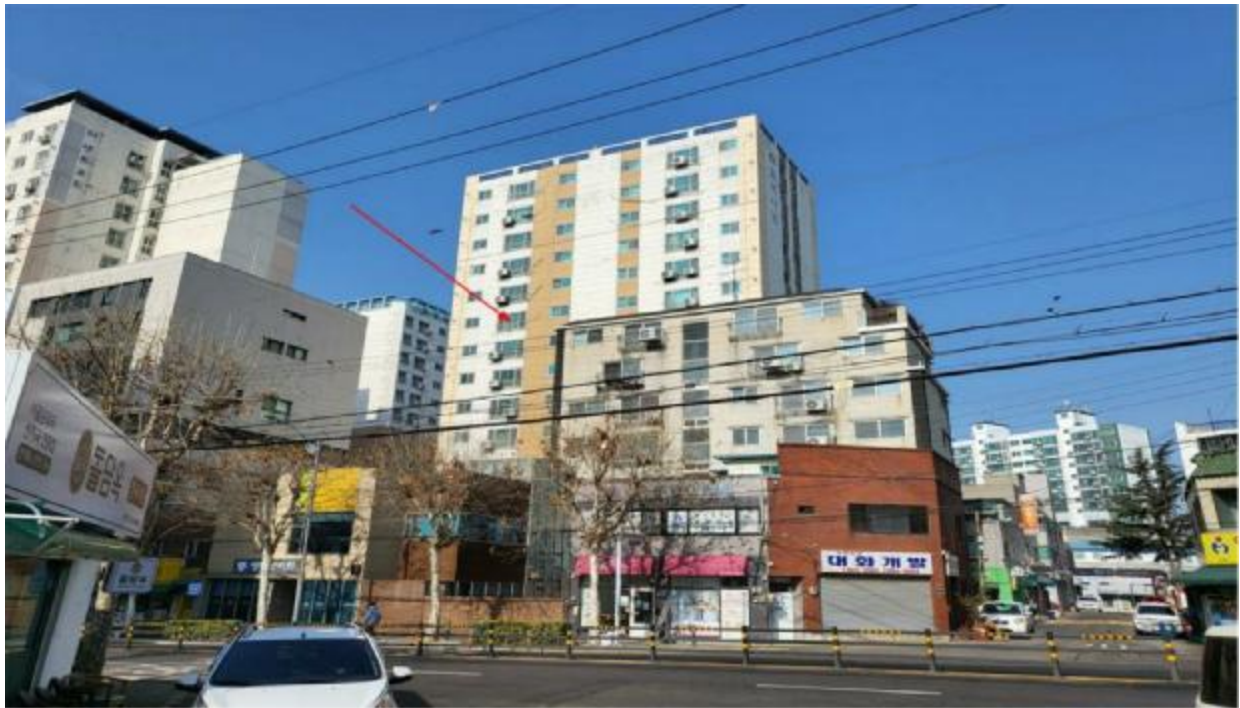
본 건 전 경