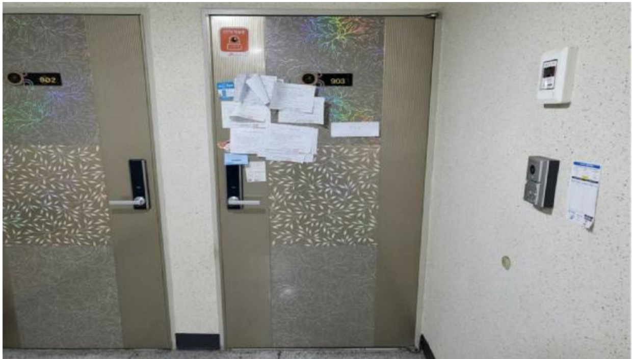
본 건 현 관