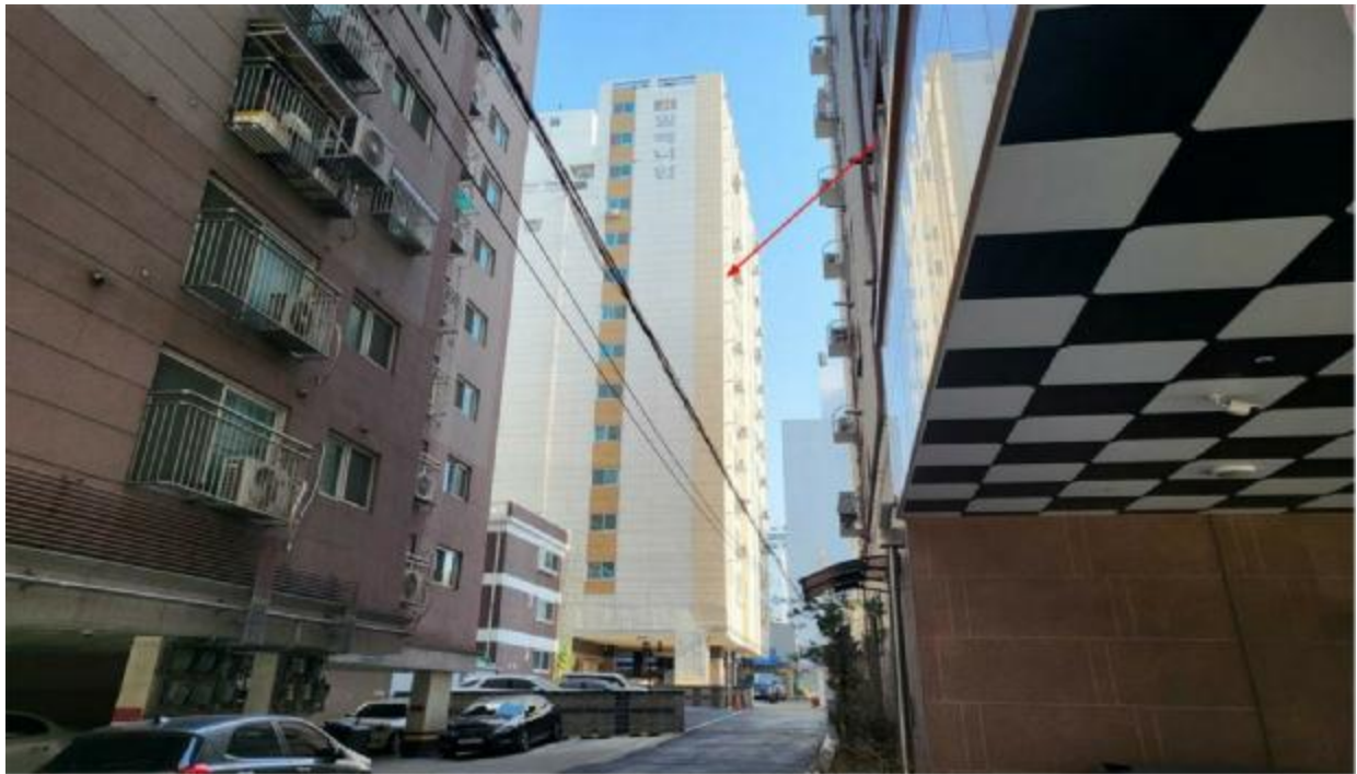
본 건 전 경