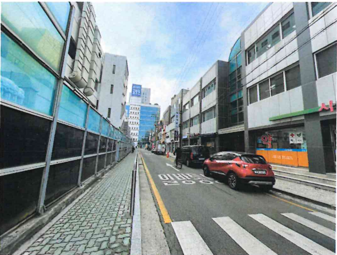
본건 남동측에서 촬영