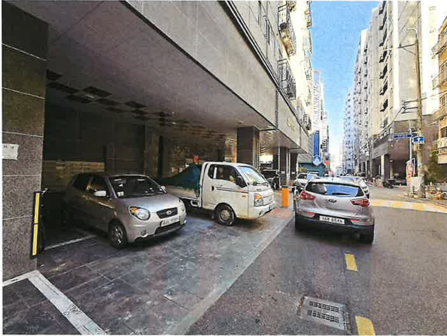
주차장 및 출입구